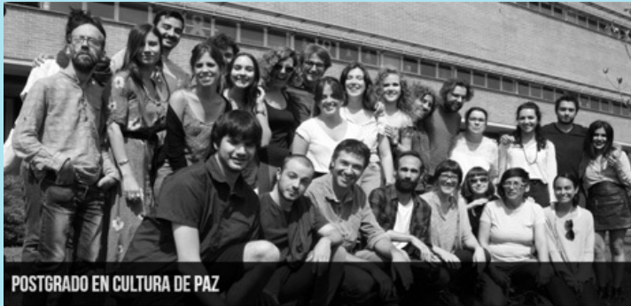
POSTGRADO EN CULTURA DE PAZ