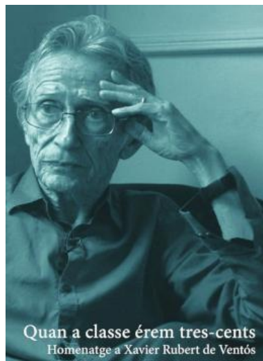
Portada del llibre homenatge publicat el 2020 per la UPC

Xavier Rubert de Ventós (Barcelona, 1939-2023) es va llicenciar en dret el 1961 i es va doctorar en filosofia el 1965 per la Universitat de Barcelona, amb una tesi d'estètica, titulada La estética de la abstracción . Fou deixeble dels catedràtics José Luis Aranguren, a la Universidad Complutense de Madrid (al seu torn deixeble d'Eugeni d'Ors), i de José María Valverde i Manuel Sacristán a la Universitat de Barcelona. Ha estat Visiting Professor a la Universitat de Cincinnati, Santayana Fellow de la Facultat de Filosofia de la Universitat de Harvard, Visiting Scholar de la Facultat d'Arquitectura de la Universitat de Califòrnia a Berkeley i Visiting Fellow del New York Institute for Humanities. Ensenyà a les dues universitats de Barcelona i a l'Escola Tècnica Superior d'Arquitectura de Barcelona (Universitat Politècnica de Catalunya), on va ser catedràtic d'Estètica i Composició des de 1973. També va fer cursos a les Universitats de Mèxic i Caracas.