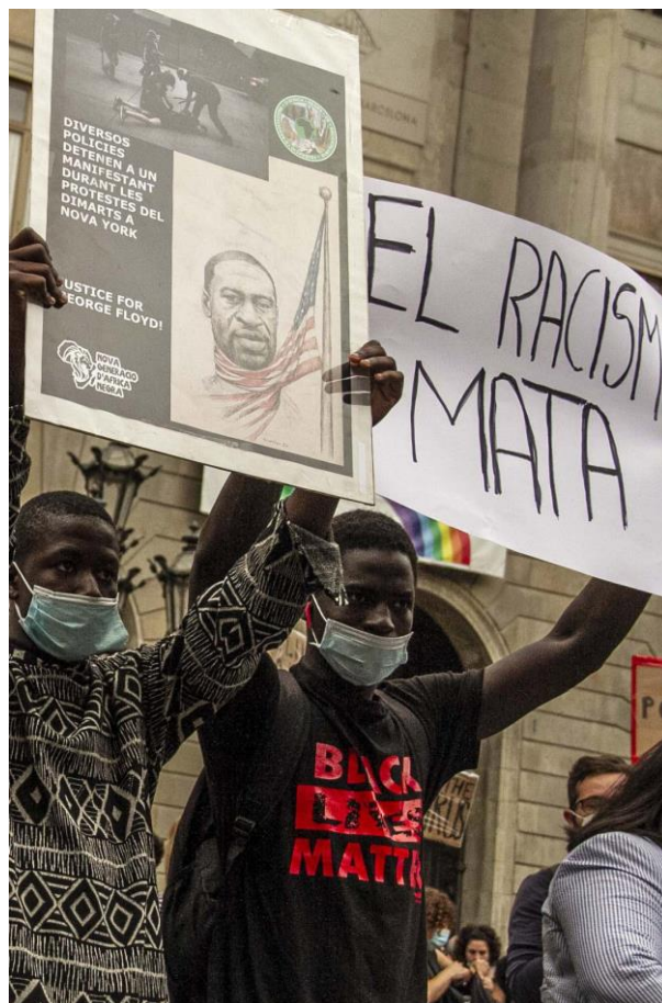
1 - Foto: Claudio Rojas V.

El Dia Internacional de l'Eliminació de la Discriminació Racial se celebra el 21 de març de cada any. Aquest dia, l'any 1960, la policia va obrir foc i va matar a 69 persones en una manifestació pacífica contra la llei de passades de l'apartheid que es practicava a Sharpeville, sud-àfrica. En proclamar-