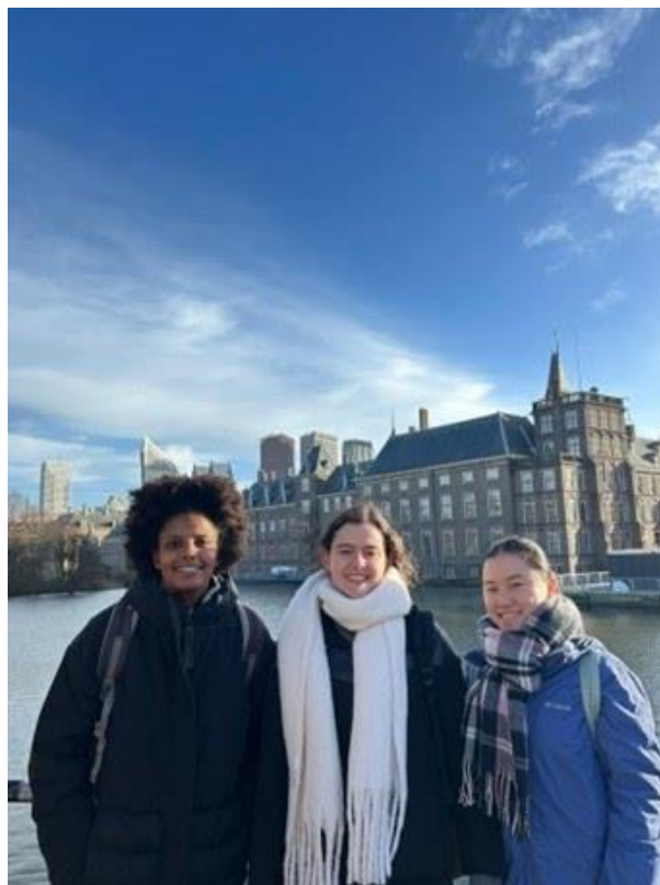
2 - Maastricht. Països Baixos

Coordinador del Grau de Relacions Internacionals i Vicedegà d'Intercanvis i Relacions Institucionals