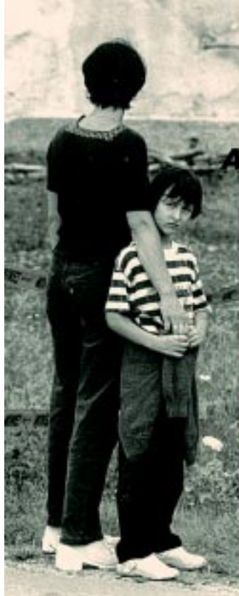
Fundació Autònoma Solidària / Moviment per la Pau

Convençuts que l'avaluació dels actors educatius ha de ser alguna cosa més que un mecanisme de control o un simple instrument per mesurar l'eficàcia, els col·laboradors d'aquest volum busquen promoure la reflexió crítica sobre l'avaluació de la docència i les seves perspectives de futur en els diferents nivells de l'ensenyament universitari. Per aquest motiu, intenten respondre, entre d'altres, als següents interrogants bàsics de la qüestió: Què s'ha d'avaluar a la docència? Qui i com ha de fer-ho? Quins efectes produeix