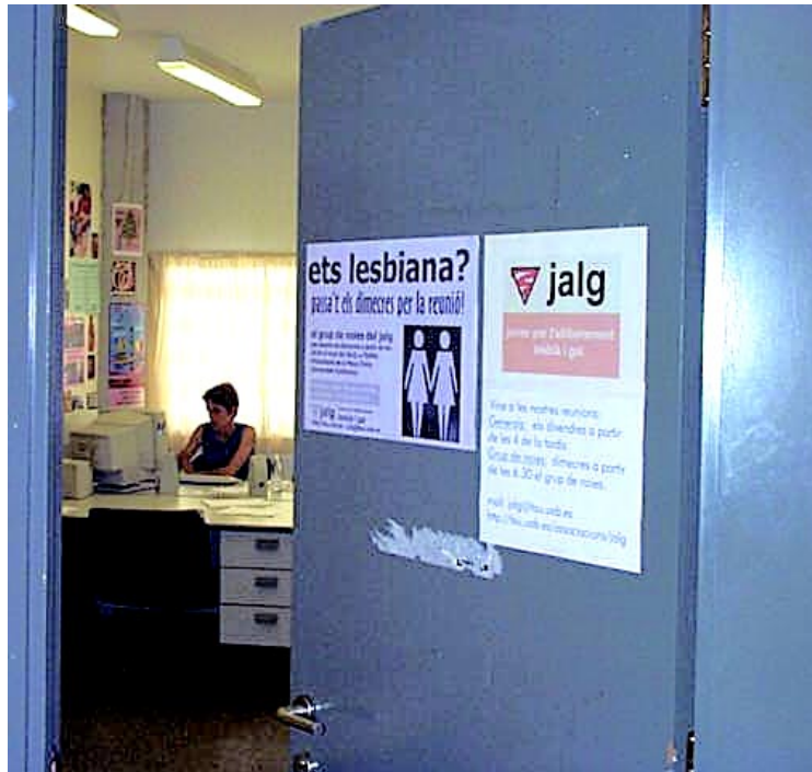
El Jalg lluita pels drets dels homosexuals.

El doctor Matteo Cavallo-Sforza de l'Institut de Física d'Altes Energies va exposar a la conferència Intel·ligència extraterrestre: per què encara no ens han visitat? , del dia 16 de maig a la sala d'actes de ciències, els motius que hi ha a favor i les raons que hi ha en contra perquè una civilització tan o molt més avançada a la humana no s'hagi comunicat amb nosaltres. Per pes científic actual guanyaren els arguments en contra de la vida i el contacte amb éssers extraterrestres intel·ligents.