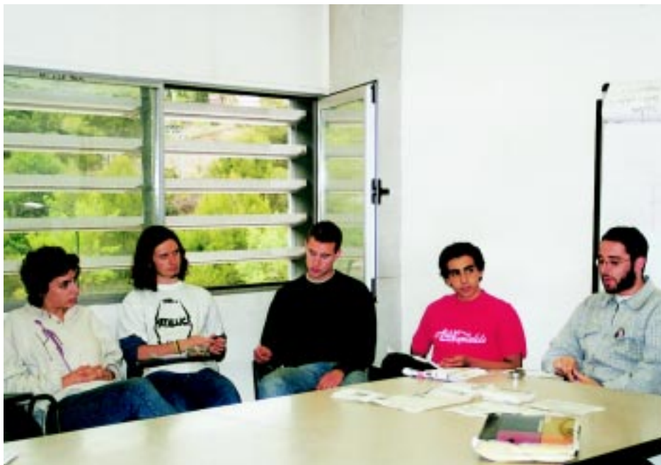
Els membres de l'MRG prenen les seves decisions de forma assembleària.