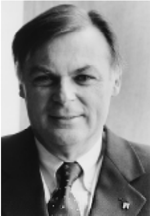
■ Carles Solà Ferrando Rector de la UAB