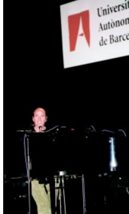
Lluís Llach durant l'acte de presentació.