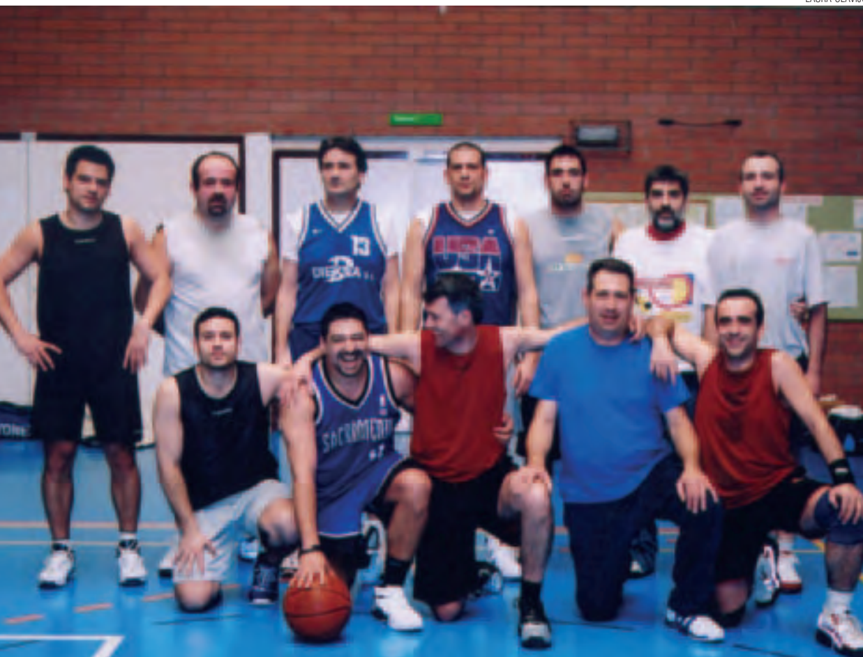
Equip de professors i ex-alumnes al pavelló del SAF.