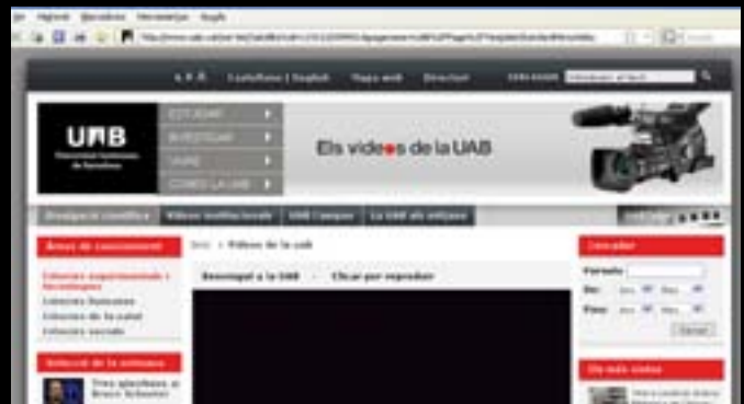
web dels vídeos de la UAB

Més enllà de l'arxiconegut i utilitzat Servei d'Intranet (SIA), col·lapsat en èpoques d'exàmens i matrícules, i l'espai acadèmic personal del Campus Virtual, cada membre de la comunitat hauria d'exprèmer al màxim el conjunt de blocs, espais de vídeo, wikis i d'altres serveis que ens ofereix la UAB. La docència, la recerca i el lleure de la Universitat Autònoma de Barcelona a l'abast d'un clic.