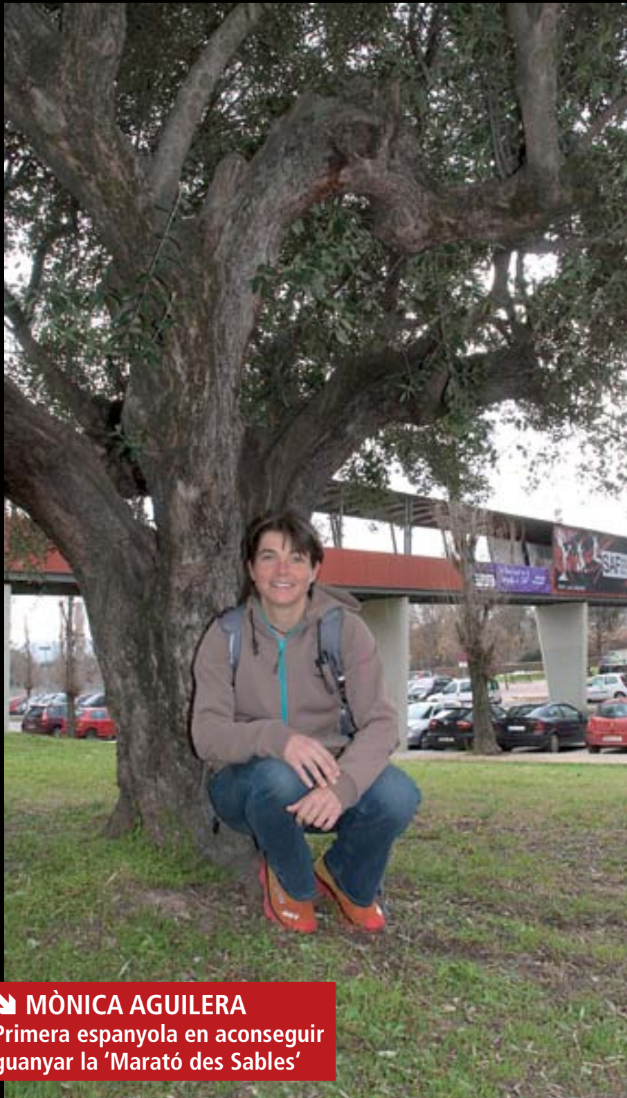
➤ MÒNICA AGUILERA Primera espanyola en aconseguir guanyar la 'Marató des Sables'