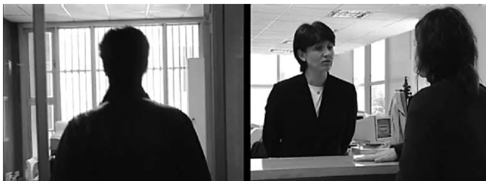
Fig. 5. Fotogramas de “La Oficina Judicial” (GRES, 2002)

mos en los barrios de Charf-Bendibane y Beni-Makkada de Tánger, y en Beni-Mellal, en el centro agrario de Marruecos (la llanura de los Fosfatos) donde residimos con su familia, estuvimos en los centros de acogida de Cataluña y de Tánger, entrevistamos a diversos responsables de asociaciones educativas que trabajaban con niños y jóvenes de la calle.... Sin embargo, no acertamos a reflejar en imágenes de forma satisfactoria por qué se producen estas situaciones ni el itinerario de vida o “proyecto migratorio” de nuestro protagonista. Debemos regresar a las casi 30 horas de grabación de las que disponemos para volver a contar la historia.