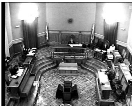
Fig. 3. Sala de Jurado de la Audiencia Provincial de Barcelona. Toma frontal (GRES, 1996)

La tensión entre la calidad de la expresión y el carácter del estudio o de la etnografía científica existe y no debe negarse. Algunas veces, ambos aspectos se combinan en un producto que satisface las condiciones de ambos campos, el artístico y el científico. En otras, especialmente cuando la atención necesaria para la producción no es óptima, la tensión entre estos dos polos no se deja dominar y el resultado final se resiente de ello. Es importante entender que, tratándose de producciones audiovisuales, el empleo del video no es solamente una técnica auxiliar de la docencia o para la diseminación, sino que pronto cobra entidad propia como producto independiente, con reglas propias. Es fruto de un trabajo profesional, cuyos mínimos son tan exigentes como los de la producción científica y académica (Fig. 4).