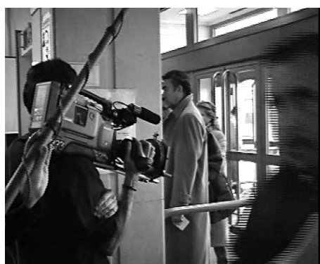
Fig. 4. Grabación de interiores en los Juzgados de Plaza Castilla (Madrid) para “Aula de la Justicia” (GRES, 2003).