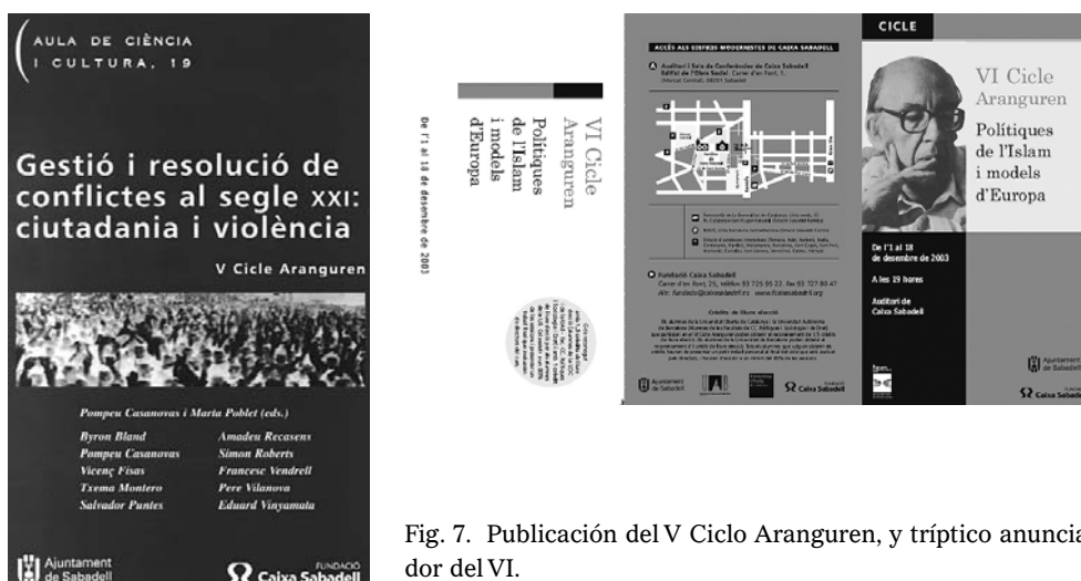
Fig. 7. Publicación del V Ciclo Aranguren, y tríptico anunciador del VI.

preocupación ética, la transformación de la sociedad y del estado en un mundo globalizado, los nuevos ciudadanos europeos —la inmigración— y, finalmente, el impacto de la tecnología, Internet y la sociedad del conocimiento.