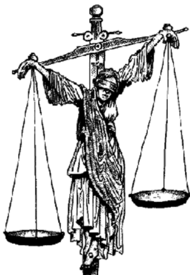
Fig. 1. Argentina.

El punto interesante de esta primera acepción es que las proposiciones implícitas contenidas en las imágenes constituyen una serie de códigos transmisibles, compartibles en cuanto conocimiento almacenado como “sentido común”. Este contenido es implícito, tácito y complejo, pero el acto de su transmisión a través de las imágenes es muy rápido y se produce de una forma natural para el sujeto que lo recibe. Es más rápido captar una imagen que descodificar un alfabeto simbólico en una lengua natural. Bien, me estoy refiriendo a la transmisión cultural de conocimiento.