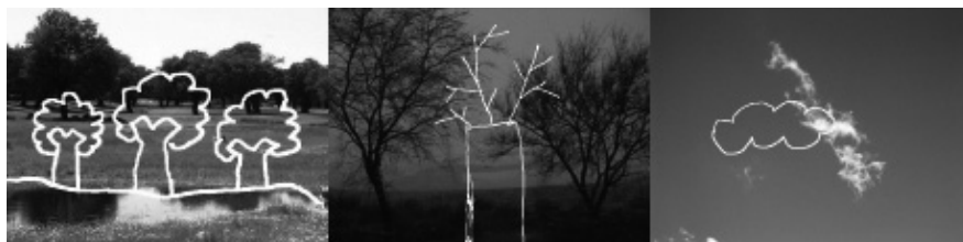
Figura 2. Imágenes extraídas del DVD del dibujo

En la formación de futuros maestros, se entiende que la educación artística es básica para la formación integral del individuo, puesto que da elementos para poder pensar, para comprender y para expresar, es decir, toda una serie de aspectos que forman parte de una comunicación no verbal. El arte no es una isla, sino una forma de conocimiento.