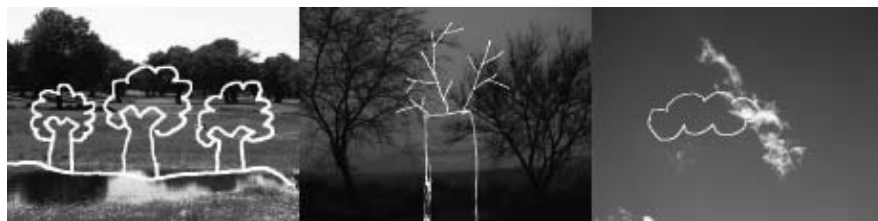
Figura 2. Imatges extretes del DVD de dibuix

Les imatges de la figura 2 prenen un significat més interessant en el context de l'àrea si les acompanya un text que expliqui per què hi són. Aquest cas és molt il·lustratiu de la dificultat que, en general, hi ha a l'hora de dibuixar. Normalment se surt del pas amb imatges estereotipades, ignorant la possibilitat d'observar; cal, doncs, aprendre a mirar.