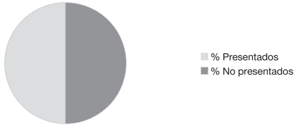
Gráfico 5. Datos del curso académico 2006-2007, comparación del porcentaje de presentados y no presentados

El cuadro 1 contiene los resultados obtenidos en cada curso: