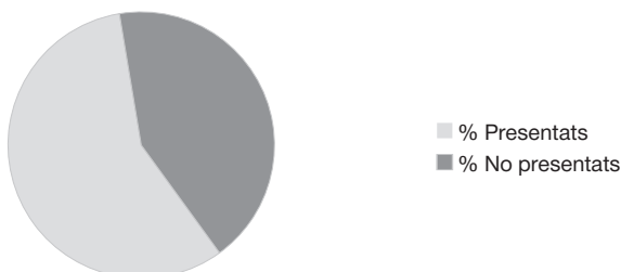
Gràfic 4. Dades del curs acadèmic 2005-2006, comparació del percentatge de presentats i no presentats