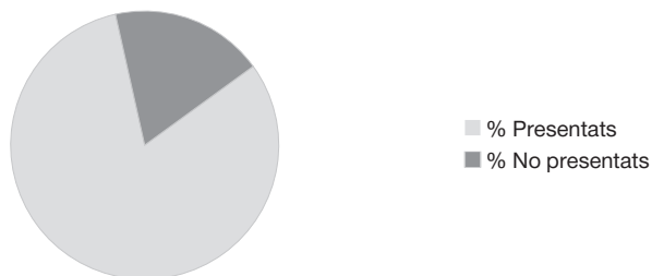
Gràfic 1. Dades del curs acadèmic 2002-2003, comparació del percentatge de presentats i no presentats