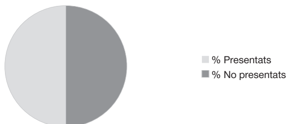
Gràfic 5. Dades del curs acadèmic 2006-2007, comparació del percentatge de presentats i no presentats