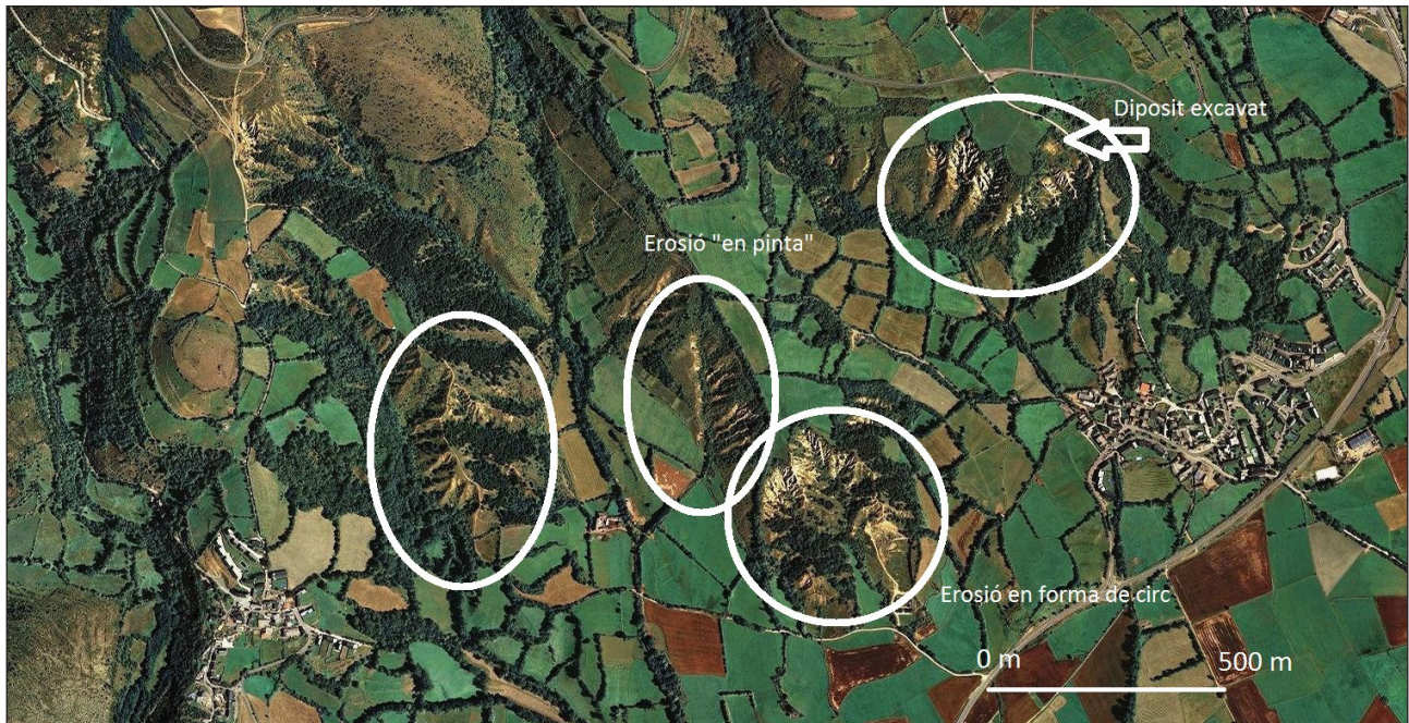
Figura 3. Mines d'All. Erosions de l'àrea de les Guilleteres. Elaboració a partir d'imatge ICC 2015. En blanc, principals àrees d'erosió de possible origen antròpic vinculades a l'explotació de l'or al·luvial.

km. De les mines d'All), i amb la recent troballa al Castellot, a mitjan s. II aC., d'un taller pol·limetalúrgic, on hem documentat amb seguretat el treball de l'or i la plata (MONTERO et al. , en premsa).