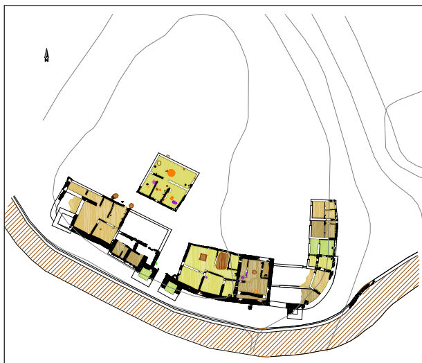
Figura 2. El Castellot de Bolvir. Fase republicana.

d'Aule Gel·li (Nits Àtiques, 2, 22, 29) a les mines Cis Hiberum conegudes per Cató, en un context que porta a pensar en àrees properes al Pirineu, una zona rica també en metalls com indicarà anys després Plini ( NH , 4, 112). Recents treballs arqueològics han mostrat la presència d'una incipient mineria del ferro a les cotes altes pirinenques, amb una cronologia dels s. II-I aC., que molt bé podrien tenir alguna relació amb les referències de Cató 4 . En aquest sentit, sembla que en alguns sectors pirinencs la primera presència romana apareix lligada a l'interès pel mineral del ferro, possiblement per unes necessitats d'aprovisionament local, que caldria vincular a uns primers establiments militars de control territorial.