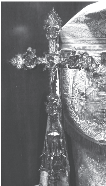
Creu processional de plata de Sant Julià d'Altaura, segle XVI. Conservada juntament amb altres tresors litúrgics del període en l'església arxiprestal de Sant Fèlix.

guns d'ells gòtics. Amb això podríem afirmar que el que es considera més sagrat i simbòlic dels temples cristians es va poder salvar. A aquests objectes se li han de sumar altres de no menys importància, com ara la mateixa Verge del Roser (talla en fusta del XVI), diferents escultures, algun gran tabernacle barroc, missals, alguns vestuaris de culte antics i algun petit retaule del XVIII, entre d'altres. Molts d'aquests objectes es dipositaren al Museu de la ciutat.