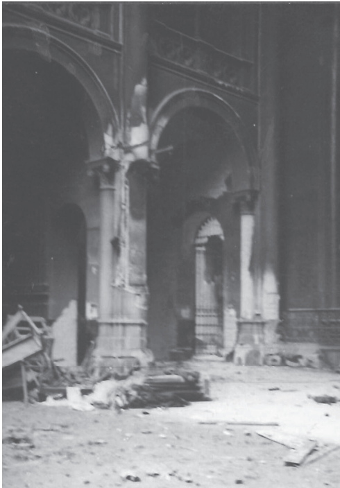
Interior de la Puríssima, gener de 1937. Fons Antoni Martí Basté de la Biblioteca Miquel Carreras. Fundació Bosch i Cardellach.

Sembla que se salvaren de la fúria destructora del juliol de 1936 dos temples de renom: l'església preromànica de Sant Nicolau i la modernista de Sant Agustí (Escoles Pies). La primera ja tancada al culte des del 1915, on s'hi estaven realitzant treballs arqueològics sota la direcció del Museu de la ciutat i la segona, obra del col·laborador de Gaudí Bernardí Martorell, pel fet que es tractava d'un crèdit hipotecari de la Caixa d'Estalvis de Sabadell i s'acordà no destruir-la.