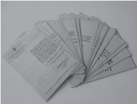
Informes repressius, signats per Emili Matalonga Cortes, Cap del Servei d'Informació de Falange. AHT-ACVOC: Fons Jutjat de Terrassa, núm. 1. Instrucció penal. Responsabilitats polítiques.

format part del Front Popular, establint la confiscació de tots els seus béns, que passarien a ser propietat de l'Estat, el Decret-Llei de 10 de gener de 1937; va crear una estructura administrativa responsable de les confiscacions: una Comissió Central de Béns Confiscats per l'Estat i altres Comissions a cada província.