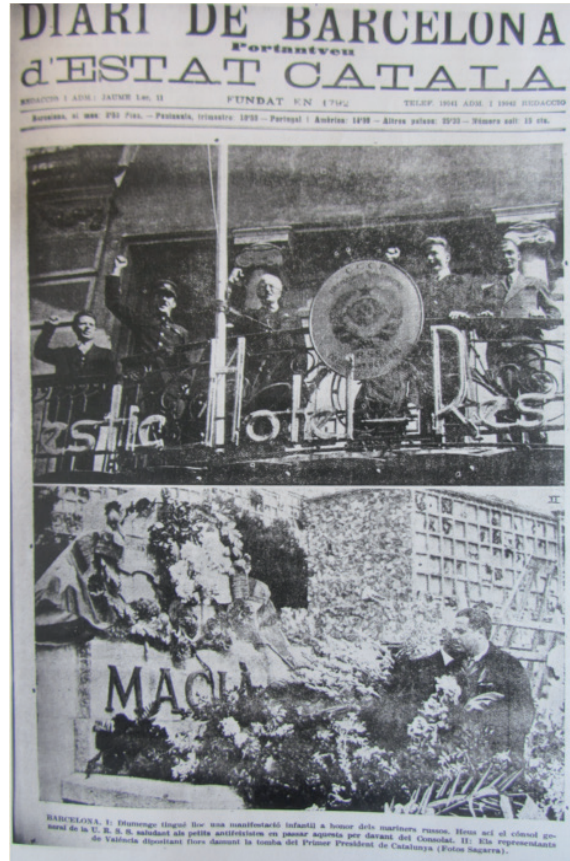
El cònsol Ovseenko al balcó de la seu diplomàtica en la portada del portaveu de l'independentisme català durant la Guerra Civil, el Diari de Barcelona , del 20 d'octubre de 1936.