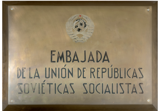
Amb el trasllat del Govern Negrín a Barcelona, l'ambaixada soviètica ocuparia el lloc del consolat (Mútua universal).

que Companys li havia fet arribar des de les seves primeres trobades al Palau de la Generalitat. Azaña els negà tots, del primer a l'últim. En canvi, allò que no va poder negar va ser l'existència d'un moviment separatista que estava guanyant força a Catalunya però, alhora, es mostrava convençut que mai assoliria suficient suport polític i social per poder executar un procés separatista. Aquesta llista de greuges no era cap novetat i, fins i tot, era anterior a la figura d'Antonov-Ovseenko. Ilià Ehrenburg, el primer representant extraoficial que les autoritats soviètiques enviaren a Catalunya probablement, i més específicament