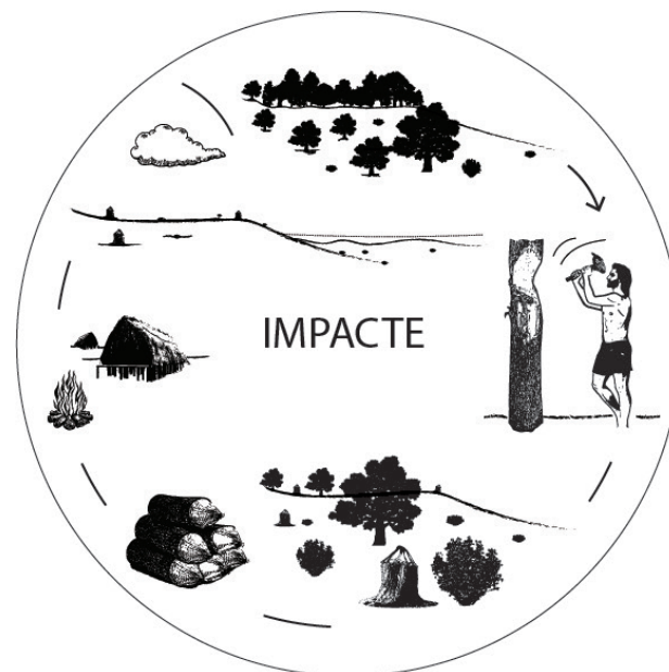
Fig. 21. L'ús del roure va produir un retrocés de la massa forestal del voltant del poblat.

En definitiva, l'adopció d'un mode de vida basat en la inclusió de l'agricultura i la ramaderia en l'organització de la societat va causar un profund canvi en la relació establerta entre els humans i el seu entorn. Aquest canvi econòmic va comportar canvis socials, inclosos el sedentarisme, l'augment demogràfic i les activitats productives cada cop més intensives i més reiterades en un mateix territori. Malgrat que als registres pol·línics regionals l'impacte agrícola no està fortament evidenciat, l'organització social configurada al voltant d'unes comunitats que basaven la seva subsistència en l'agricultura i la ramaderia va provocar canvis importants en la configuració del paisatge. Així, la gran inversió de recursos i de treball implicada en l'adopció de l'agricultura va suposar l'eix vertebrador del patró d'assentament en el territori des d'època neolítica. D'aquesta manera, aquests canvis van iniciar un procés progressiu de transformació del medi que expliquen com s'ha configurat el paisatge actual (Fig. 22).