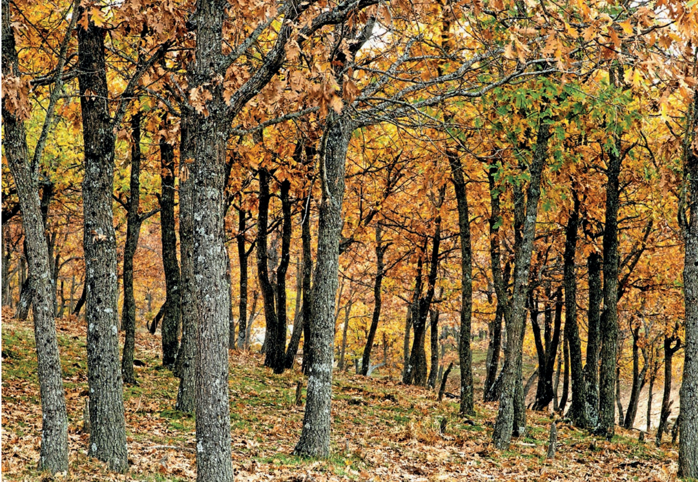
Fig. 20. Les rouredes properes al poblat constituïen un espai de gran diversitat en flora i fauna.