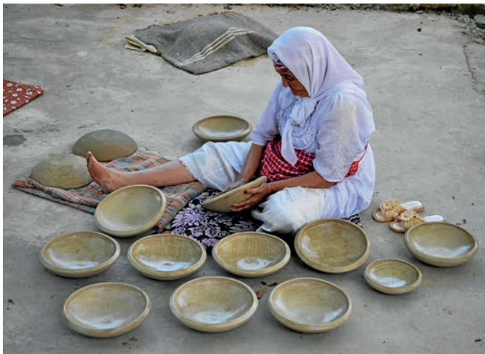
Fig. 53. Producció actual de ceràmica a mà a Algèria.