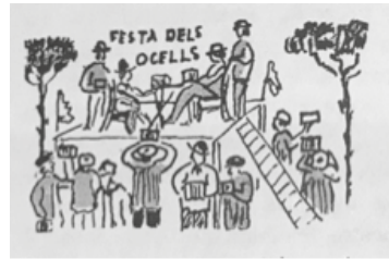
Dibuixos de Marian Burguès

tingué Sabadell a l'escola dels baixos de la Casa de la Vila del carrer de la Rosa. No era una obra d'art, emprò era admirat per la grandària i el record del còlera. Els dibuixos il·lustren aquests textos 14 .