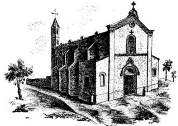
Santuari de Pasqual i Tintorer, 1882