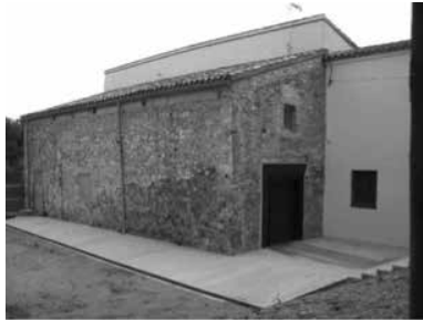
Ermita de sant Iscle i santa Victòria avui