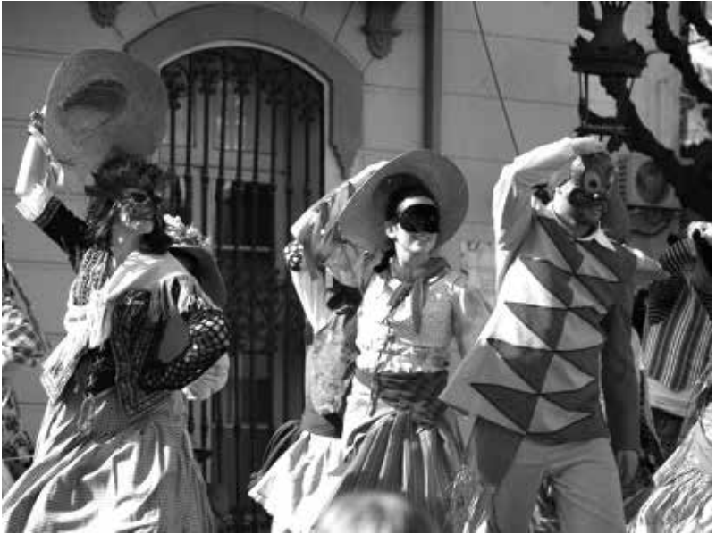
El Manyó ballant el ball del barraló, 2017.

amb músiques de Josep Maria Aparicio. L'Esbart dansaire de Mollet executa dalt de l'escenari unes coreografies dinàmiques i senzilles inspirades en el caràcter popular i estrafolari de l'antic barraló, que juntament amb un vestuari colorista que inclou faldilla i barret per a tothom, ha esdevingut una peça clau per donar la benvinguda al senyor de Carnestoltes en una plaça plena de gom a gom.