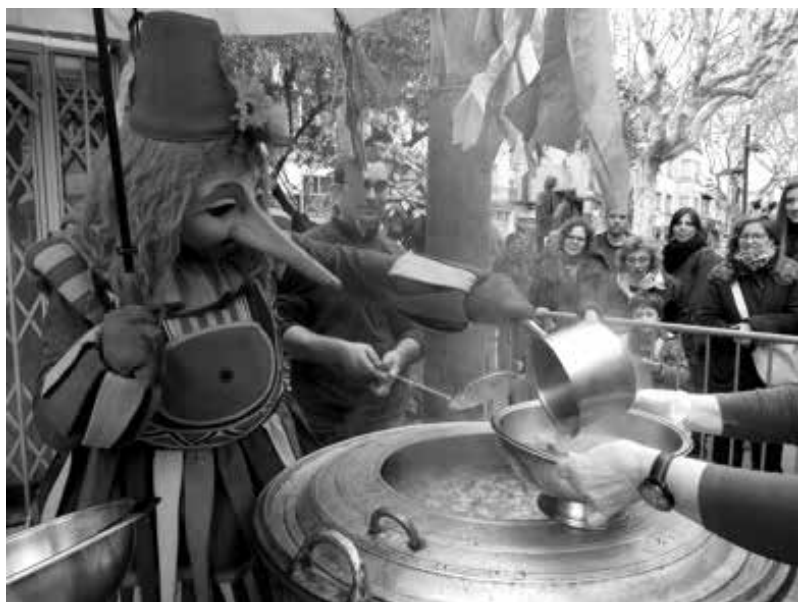
Carnestoltes de Mollet repartint l'escudella de Carnaval.

Catalunya, 16 algunes de tradició antiga, altres creades el darrer quart del segle XX. La majoria es fan per Carnaval o per Nadal. Al Vallès, seguim l'estela de les de Castellterçol i Sant Feliu de Codines, avui també hi ha escudelles de Carnaval a l'Ametlla, Bigues, Mollet del Vallès i Sabadell. Trobem escudelles per Nadal o altres dates a Caldes de Montbui, Cardedeu, les Franqueses, Granollers, Lliçà d'Amunt i Gallifa. Si el Vallès ha esdevingut una terra d'escudelles populars ha estat, sens dubte, gràcies a l'empena divulgadora del cuiner Pep Salsetes.