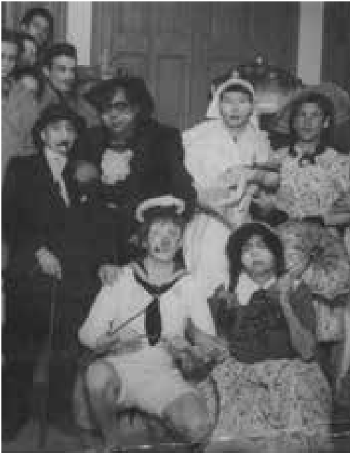
Vestíbul de l'Ateneu de Mollet, 1945. (Font: família Ros Sabaté, arxiu de l'autor)

1951, organitzat per l'empresa Continental i una comissió local, hi figura fins i tot un "pasacalle" del "Carnestoltes" i un refrigeri de "Botifarra i pa amb tomàquet", així en català. A partir de 1953, però, s'entra en un període en que la censura imposa els seus criteris, es deixa de parlar de Carnaval i els balls de disfresses s'anomenen "bailes de trajes."