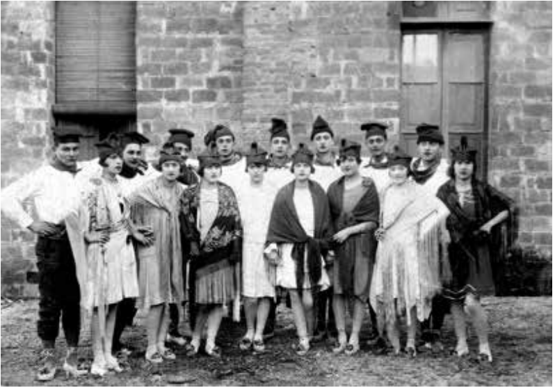
Colla del ball de gitanes, anys 20.

turals i polítics sorgits amb la Renaixença van influir en les pràctiques festives, a voltes per revitalitzar-les, i per generar tensions en altres moments.