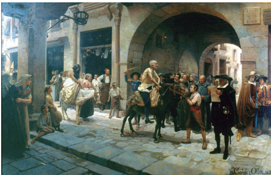
FIGURA 7. Bòria Avall , 1892, obra de Francesc Galofre Oller, donada per Caixa Tarragona.