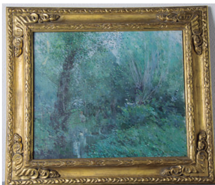
FIGURA 5. Arbreda , 1922, obra d'Ignasi Mallo, donada per Francesc Blasi Vallespinosa.

La collecció donada al Museu va ser petita però interessant, pels artistes representats, i molt coherent. Feta als anys vint, estava formada per una trentena de peces, de les quals hi havia onze olis sobre tela, una escultura, diverses aquarel·les i dibuixos, a més d'algunes peces en ceràmica.