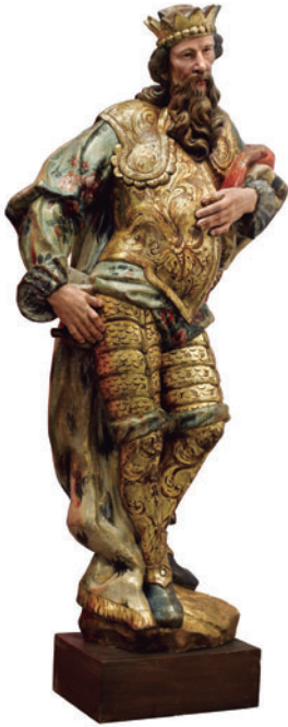
FIGURA 9. Sant Rei, de Lluís Bonifàs, donat per Cèsar Martinell.

ta d'entusiasme em desanima. Em dol aquesta actitud perquè el meu desig era d'una màxima col·laboració. 20