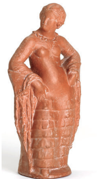
FIGURA 6. Manola , 1932, obra de Manolo Hugué donada pel Dr. Estil·las.

Més enllà d'aquests dos artistes, la seva col·lecció té dos blocs prou ben definits. El primer, format per artistes de la seva generació, nascuts a les últimes dècades del segle XIX, amb noms com Enric Galwey, Alexandre de Caba-