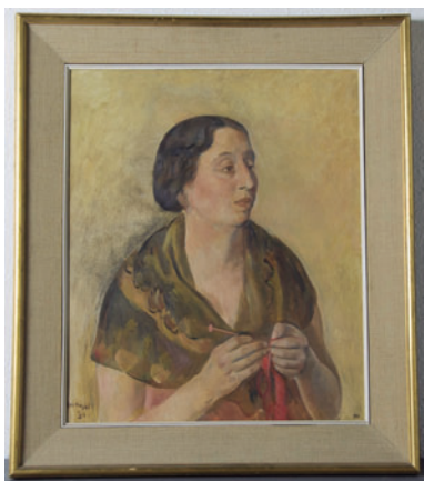
FIGURA 8. Retrat de la dona del pintor , 1930, obra de Joaquim Sunyer, donada per la Fundació Rodón-Giró.

També cal citar les set pintures d'Emili Grau Sala i les vuit d'Àngel Cànovas, amb obres dels anys trenta i seixanta. Dues peces de Joaquim Sunyer, un retrat de la seva dona de 1930 (figura 8) i una maternitat de l'any 1953; sis d'Enric Casanovas, una escultura, de principis dels anys quaranta, i quatre dibuixos, dels seixanta, i un dibuix de Joaquim Nonell.