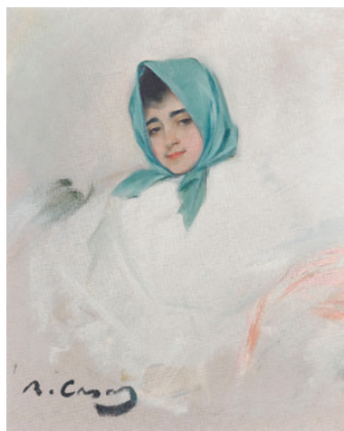
FIGURA 14. El mocador blau , 1898, obra de Ramon Casas, dipòsit del Fons d'Art de la Generalitat de Catalunya al Museu de Valls.