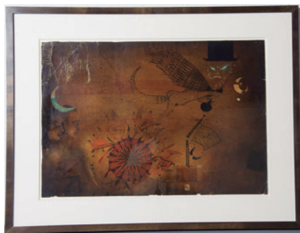
FIGURA 10. Tàpies de l'any 1950, obra de la col·lecció de Francesc Català-Roca.

D'altra banda, l'any 1998, pocs mesos després de la mort de Francesc Català-Roca, el Museu va organitzar una exposició del seu germà Pere. Per primera vegada es veia una exposició individual del seu treball fotogràfic. La col·lecció presentada, formada per cinquanta-una imatges, d'entre els anys cinquanta i setanta, van ser donades pel fotògraf al Museu.