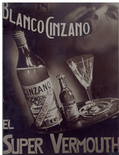
FIGURA 15. Publicitat de la casa Cinzano, realitzada per Pere Català Pic, adquirida pel Museu de Valls.

la voluntat de l'administració municipal, titular del Museu. Això explica el seu decantament cap al món de l'art.