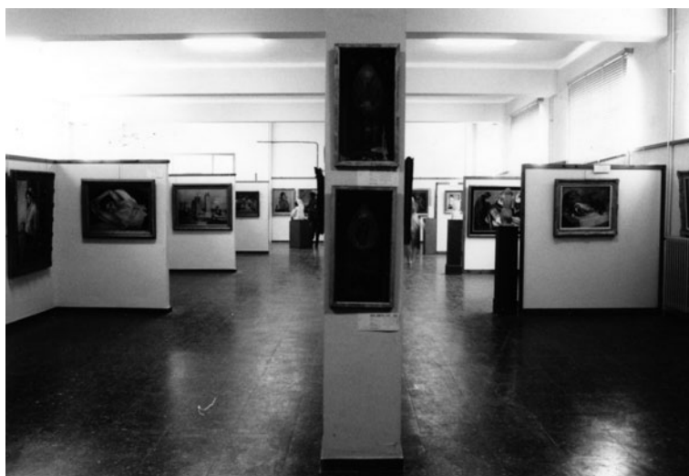
FIGURA 4. Sala del Museu de Valls a la Casa de Cultura, als anys vuitanta.

Dos anys després, l'any 1986, l'Ajuntament i la Generalitat es posaren d'acord per fer millores en la institució. En primer lloc, es realitzà el projecte museològic i museogràfic; seguidament es va constituir legalment la Fundació Pública Municipal Museu de Valls, i es va contractar, l'any 1987, per primera vegada, un tècnic per gestionar-lo. Dos anys més tard, s'iniciaren unes obres, pagades per la Generalitat de Catalunya, per remodelar els espais existents, i el 1993 s'obrien al públic. Vint-i-cinc anys després, el Museu està a les portes de fer una nova remodelació que comportarà una ampliació dels seus espais.