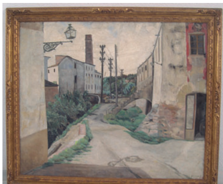
FIGURA 11. Torrent de Farigola, obra dels anys vint de Jaume Mercadé, adquirida pel Museu.

L'última entrada d'obres de Mercadé va ser l'any 2014, gràcies al dipòsit realitzat per la família, el qual venia a complementar la col·lecció de la institució, especialment en joieria i orfebreria, que el Museu pràcticament no en disposava. A més, ampliava la cronologia en les