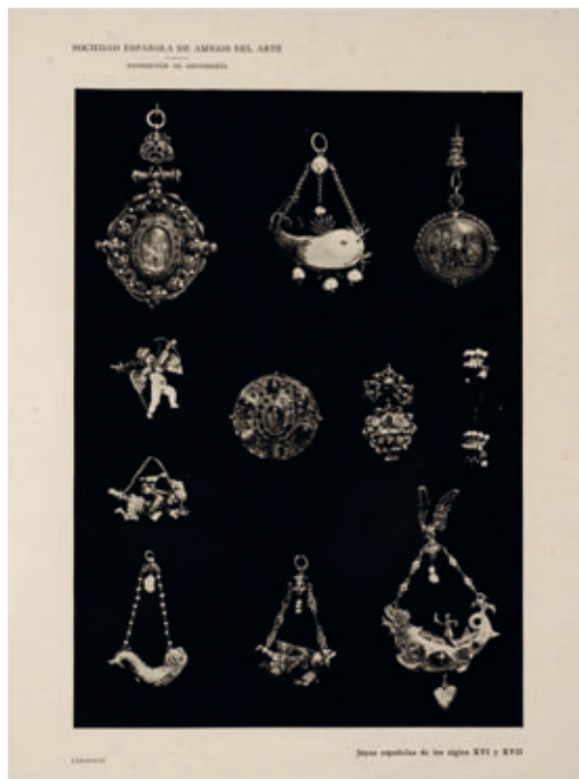
FIGURA 15. Diverses joies de la col·lecció Regordosa.

Alguns dels vestits regionals de la col·lecció també es van poder veure a l'«Exposición del traje regional e histórico», inaugurada el 18 d'abril de 1925. Se n'hi van exposar quatre: els de maja , burgesa catalana, armuñesa i eivissenca. Tots es van exhibir conjuntament a la instal·lació dedicada a Madrid (situada a la sala d'ingrés), tot i pertànyer a àmbits territorials diferents. La guia que es va editar amb motiu de l'exposició en fa la descripció següent: