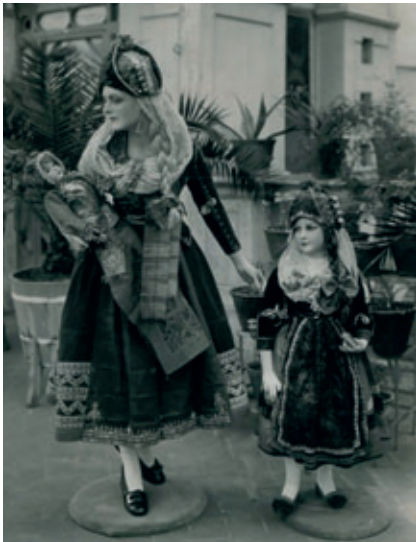
FIGURA 10. Maniquins amb vestits de segoviana. Fons Regordosa. Centre de Documentació del Museu del Disseny de Barcelona