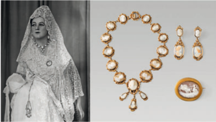
FIGURA 11. Maniquí amb vestit de burgesa catalana i nadó en braços. [esquerra], i Adreç del maniquí de burgesa catalana [dreta]. Museu del Disseny de Barcelona (MADB 135335; MADB 135338; MADB 135337; MADB 1353358).