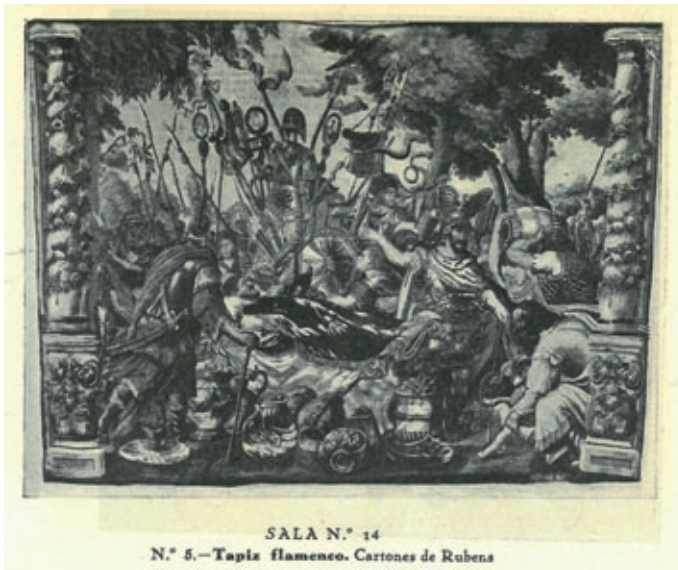
FIGURA 13. Tapís de la col·lecció Regordosa representant Les exèquies de Deci Mus . Font: Catálogo del Palacio de Bellas Artes: sección de arte antiguo (1930), s.p.

romà Publi Deci Mus. Estaven basats en uns cartrons creats per Rubens per encàrrec d'un noble genovès, alguns dels quals es conserven al Museu Liechtenstein de Viena. Segons la premsa històrica, van ser adquirits a Mallorca. 61 És interessant destacar que es tracta, a més, d'una sèrie completa, cosa poc habitual en una col·lecció particular, ja que en la resta de les identificades només es conserven panys solts. 62 Diverses imatges d'aquests tapissos apareixen publicades als catàlegs de les mostres de Sevilla (1929) i Barcelona (1935), encara que a les fotografies panoràmiques de les sales conservades també es poden identificar alguns dels exemplars. 63 Tal és el cas dels tapissos amb les escenes Els cònsols Publi Deci i Tito Manlio marxen a combatre contra els llatins , Deci Mus conta el seu somni , Deci Mus consulta l'Oracle , Marc Valeri beneeix Deci , Deci s'acomia dels lictors , Les exèquies de Deci Mus (figura 13), La batalla de Vesperis amb la mort de Deci Mus i Mart i Rea , però desconeixem la resta d'assumptes.