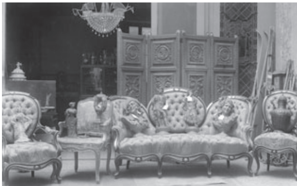
FIGURA 17. Mobles i objectes de la col·lecció Regordosa al Palau Solferino en el moment de la recuperació (1939).