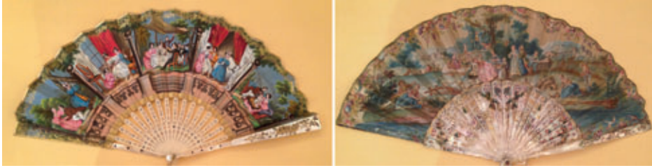
FIGURA 9. Ventalls de la col·lecció Regordosa amb els motius «Festa campestre» (cat. 213 dreta) i «Nuviatge i esposalles» (cat. 275, esquerra). Col·lecció Duch Antigalles, Barcelona.

corats amb làmines d'or i plata i amb pedres precioses. Els països eren en general de cabritilla, encara que també eren importants els de seda o els de paper litografiat (figura 9).