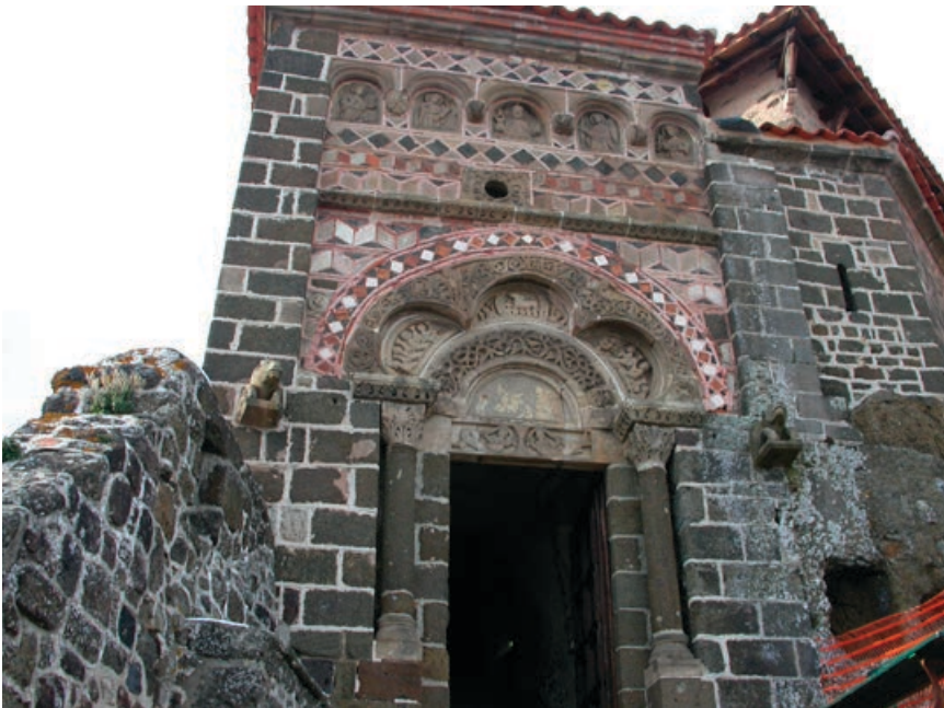
Fig. 2. Saint-Michel d'Aiguilhe: portada añadida en los años 1180 al santuario del 961. Centro: Adoración del Agnus Dei. Dintel: Sirenas (reconstruidas). Parte superior de izquierda a derecha: San Juan Evangelista, la Virgen, Cristo, San Miguel arcángel, San Pedro.

El culto a la Virgen en Le Puy prosperó a partir del siglo X, cuando su rango más bien local pasó a tener un carácter universal. Al ser el punto de partida de la Via Podiensis , desde donde multitudes de peregrinos emprendían el camino a Compostela pasando por Conques-en-Rouergue, Le Puy se convirtió en un centro neurálgico de la devoción mariana, fundado en la divina estatua custodiada en su catedral 4 (destruida por los revolucionarios en 1794 (figs. 3 y 4). En el año 951, a su vuelta de una peregrinación a Compostela, el obispo Godescalco había traído consigo el tratado de Ildefonso de Toledo sobre la perpetua virginidad de la Madre de Dios, contribuyendo así a un constante crecimiento del fervor religioso. 5 A fines del siglo XII, el cronista Anónimo de Laón testimonia el florecimiento de un culto muy importante a la Virgen en Le Puy –aunque lo critique–, que relaciona con la celebración de la fiesta mayor de la Asunción de la Virgen: