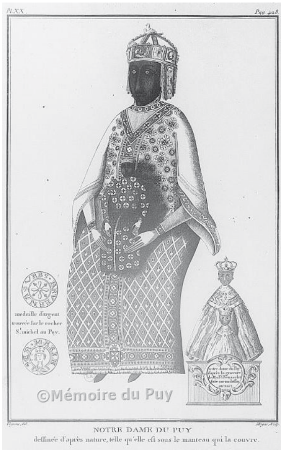
Fig. 3. Virgen de Le Puy-en-Velay. Diseño de Veyrenc para el libro de Faujas de Saint-Fond, Les volcans éteints du Velay et du Vivarais , 1778.