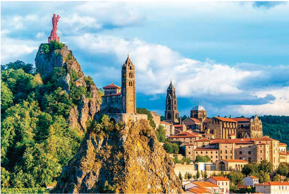
Fig. 1. Le Puy-en-Velay: capilla de Saint-Michel d'Aiguilhe en primer plano; catedral al fondo.

Tampoco se ha relacionado esta historia con la inmensa campaña de construcción llevada a cabo en Le Puy en esos mismos años 1180 (fig. 1). Esta campaña de edificación incluyó unas adiciones de categoría a la catedral y a la capilla de Saint-Michel d'Aiguilhe, construida en el siglo X por el deán Truanus, y dedicada por el obispo Godescalco en 961. 2 A mi modo de ver, la confraternidad de los Capucciatti —que adquirió mucho dinero (véase abajo)— ayudó al obispo Pedro IV de Solignac (1159-1189 3 ) a materializar esta ambiciosa campaña arquitectónica, destinada a conseguir que el centro de peregrinación mariana de Le Puy fuese nuevamente lucrativo y atractivo; Saint-Michel d'Aiguilhe, por otro lado, devino la capilla propia de la confraternidad (fig. 2).