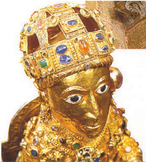
Fig. 8. Sainte-Foy de Conques, estatua de Santa Fe.