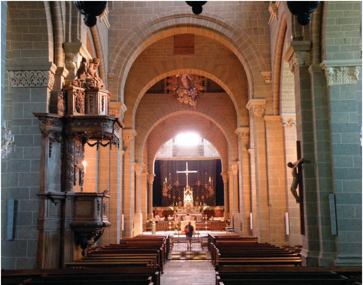
Fig. 10. Le Puy-en-Velay, catedral, vista interior al altar mayor.

Gervasio de Canterbury menciona también, hacia 1188, dicho sello mariano. 28 El cronista Geoffrey de Vigeois desarrolla la historia de modo litúrgico, empezando en la fiesta de San Andrés, cuando el carpintero (anónimo, en esta crónica) cuenta al obispo Pedro que quiere establecer la Paz. En Navidad ya son muchos los que han jurado a la cofradía, y el número de cofrades va en gran aumento hasta después de Pascua. En Pentecostés ya se ha acumulado mucho dinero y, cuando llega la fiesta de la Asunción, el obispo de Le Puy predica ya sobre la Paz. 29 Todos los cronistas se refieren al traje de los cofrades, que llevaba una capucha blanca, mientras que la imagen de la Virgen sirve como péndula sobre el pecho (fig. 5) y el Agnus Dei , mencionado por todos, se toma como su símbolo. Como se ha dicho anteriormente, se ve al Cordero de Dios en la pequeña portada añadida a la capilla de Saint-Michel d'Aiguilhe (fig. 2), construida con toda probabilidad por la cofradía de la Paz, llamada Capucciati . Este nombre se basa en su capucha tan distinta, 30 que se ve en una de las estatuas rodeando la campana (fig. 6).