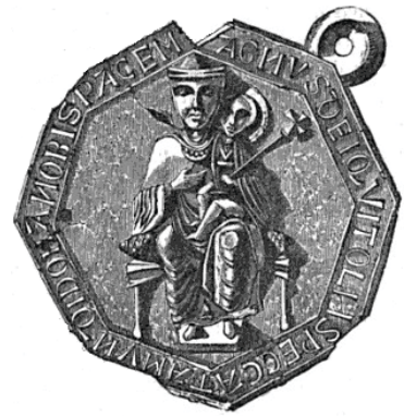
Fig. 5. Insignia de la confraternidad de los capuchones blancos. Inscrición: Agnus Dei qui tollis peccata mundi, dona nobis pacem.

La construcción de la campana de la catedral y de su Porche du For (el porche sur) (fig. 7) y las adiciones a la capilla de Saint-Michel d'Aiguilhe (incluyendo un campanario en imitación del de la catedral) 12 coinciden con la visión del carpintero y muestran la ideología de la Paz de Dios. Además, cuatro estatuas rodeando la campana catedralicia conmemoran monumentalmente a los Capucciati , destacados por su capucha 13 (fig. 6). Para inferir el contexto de las imágenes involucradas, debemos observar la estatua catedralicia y entronada de la Virgen, de la cual se dice, desde tiempo remoto, que fue milagrosa (figs. 3 y 4).