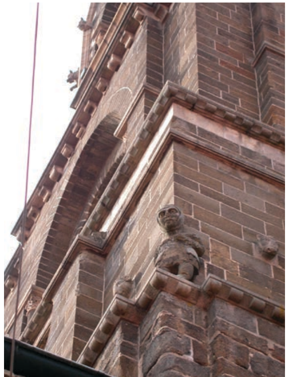
Fig. 6. Le Puy-en-Velay, catedral, campanario: estatua de un cofrade de la confraternidad de los capuchones blancos.

Así, Pedro Comestor, el célebre teólogo francés del siglo XII, y autores posteriores, desarrollando leyendas elaboradas, se refirieron con entusiasmo a la estatua de la Virgen del altar mayor de la catedral de Le Puy, hoy desaparecida, 15 subrayando que ésta era conocida preeminentemente en el mundo entero. 16 Estienne Médicis, un burgués y comerciante de Le Puy en el siglo XVI, 17 el capuchino italiano Teodosio de Bérghamo 18 y el jesuita Odo de Gissey en el siglo XVII 19 , utilizaron