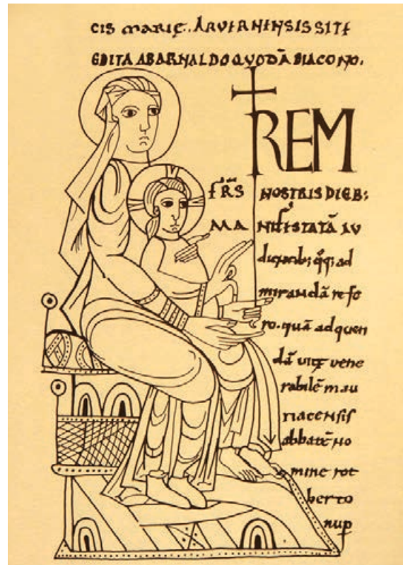
Fig. 9. Virgen dorada de Clermont, finales del siglo x– principio del siglo xi. Clermont-Ferrand, Bibliothèque municipale, ms. 145, fol. 130v.

de Angers se convierte, admitiendo que la imagen de la santa debe ser digna de veneración. Bernardo documenta el motivo: Santa Fe dejó en claro que quien deshonrara la estatua sería penado. Por lo tanto, continúa Bernardo, la imagen representa la memoria piadosa de la santa: «Es un depósito de reliquias sagradas, hechas en una forma específica sólo porque el artista lo deseaba». 23 La estatua del relicario se compara –como en el caso de la Virgen de Le Puy– con el Arca de la Alianza, y también con las perlas que adornan la Jerusalén celestial.