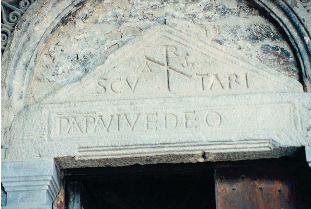
Fig. 7. Le Puy-en-Velay, catedral, Porche du For, portal. Inscripción: SCUTARI PAPA VIVE DEO.

una terminología que gozaba de una larga tradición y cuyo origen se remonta a tiempos inmemoriales, con el fin de exponer la estética teológica de la imagen mariana, llamada «la estatua de Jeremías». Creían que la Virgen del gran altar de Le Puy fue creada con madera de acacia (el shitim de la Biblia), la misma madera con la que se construyó el Arca de la Alianza. La distinguían como una imagen profética, realizada por el propio profeta Jeremías y que el rey de Francia Clodoveo II llevó a Le Puy en el siglo VII. En relación con el misterio de la milagrosa concepción del Hijo de Dios, Teodosio recuerda que «el santo Profeta Jeremías, para insinuarnos mejor el misterio de la santa Encarnación, mandó hacer la imagen de Nuestra Señora con la madera con la que había sido hecha el Arca de la Alianza, que la representaba». 20 El sacerdote de Montfaucon, Mathurin des Roys (1523) expresa esa misma convicción con las siguientes palabras: «No se trata de carpintería fabricada ni humana... sino que es obra profética, milagrosa, que realiza milagros, divina, celeste». 21 De esta manera, la estatua se convierte en una manifestación celeste y divina, una imagen achiropita .