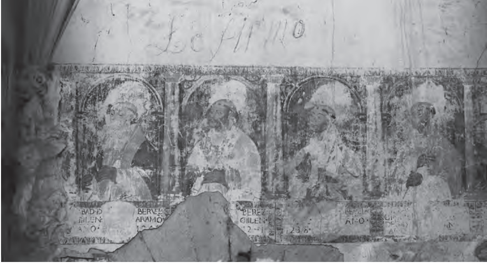
Fig. 1. Monasterio de Cambrón. Imágenes del abadologio de Veruela pintado en el siglo XVI.

de Císter, los predicadores de las órdenes de frailes también dictaron sus sermones, aunque se determinó que no tuvieran un trato cercano con las monjas (García-Oliver, 1992: 139). En paralelo a esta supervisión espiritual, la orden tuvo sus propios órganos de control. Los monasterios debían ser examinados por un visitador que se encargaba anualmente de seguir la corrección de la vida monástica, siguiendo un cuestionario que abarcaba sus distintos ámbitos y cuyos testimonios son siempre una importante fuente de conocimiento de cada comunidad en primera persona (Pérez Giménez, 2005b). 4