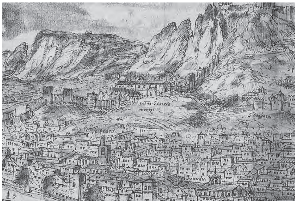
Fig. 3. Anton van den Wyngaerde. Detalle de la vista de Játiva en 1673, Österreichische Nationalbibliothek, Viena.

Un pleito de la abadesa de la Saïdia de 1402 describe cómo la monja Beatriu de Poblet se había encerrado en su celda para evitar recibir la orden de acatamiento de la nueva abadesa (García-Oliver, 1992: 152). Al igual que en Vallsanta o en Vallbona, en Gratia Dei, el Pedregal, Montsant y Valldonzella el dormitorio común debía destinarse a las monjas menos favorecidas, en tanto que las restantes residían en cámaras individuales. A comienzos del siglo XVI, se distribuían viviendas particulares por el sobreclaustro de varios monasterios, a la vez que se fueron construyendo casas en propiedad en su perímetro del monasterio que, en el caso concreto de Vallbona, llegaron a tener personalidad urbana en el exterior de la cabecera de la iglesia monástica. La costumbre desagradó especialmente al cronista de la visita general de Edme de Sanlieu en 1531 tanto a Vallbona («multoplures camerae particulares quam moniales») como al Pedregal («camerae particulares tunc puellis plenas») (Bronseval, 1970: I, 178-181).