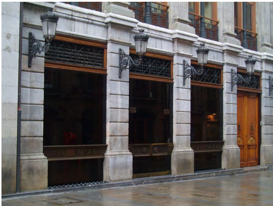
FIGURA 2. Fachada de la Casa Masaveu [estado actual], Oviedo.

El decimonónico edificio administrativo de la Casa Masaveu, 19 localizado en el número 8 de la calle de Cimadevilla (figura 2), cuenta con fachada secundaria a la plaza de Trascorrales y es resultado de la unión de varios inmuebles próximos para levantar el espectacular inmueble en 1885, con proyecto (figura 3) del arquitecto Javier Aguirre Iturralde (1853-1926). Se trata de un «edificio mixto comercial-financiero y residencial» que destaca por el empleo de materiales nobles y el cuidado con que se ejecutó cada una de sus partes. 20