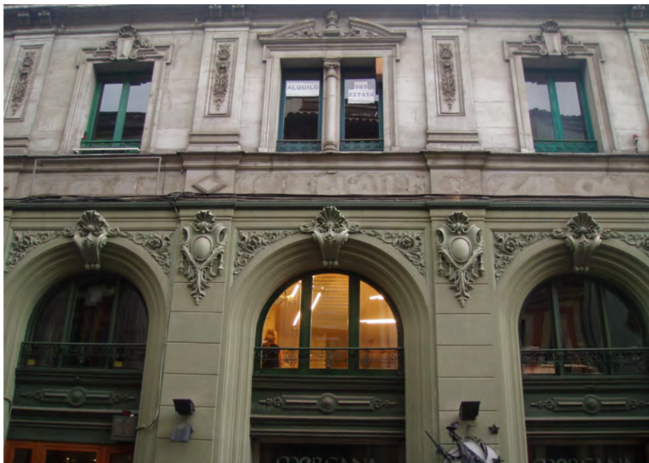
FIGURA 4. Fachada del Bazar Masaveu [estado actual], Oviedo.