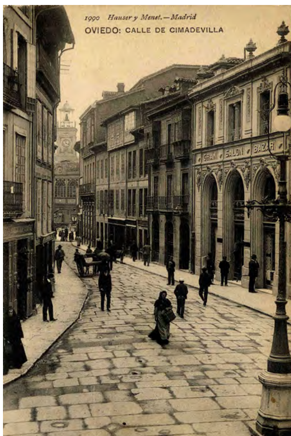
FIGURA 1. Aspecto de la calle de Cimadevilla de Oviedo durante los primeros años del siglo xx.

La calle ovetense de Cimadevilla (figura 1) acogió varios negocios que solían presentar el trabajo de los artistas locales en sus escaparates desde el siglo XIX, aunque fue desde 1916, 9 año en que se celebró la Primera Exposición de Bellas Artes, cuando las muestras temporales de pintura comenzaron a tener una mayor entidad. La segunda mitad de los años diez del siglo XX fue un momento especialmente dinámico en lo que a actividades artísticas se refiere. A pesar del apartamiento de la ciudad de las plazas más destacadas del pa-