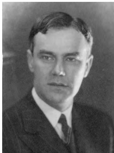
FIGURA 5. Ramón García Duarte: Retrato de Martín Masaveu Masaveu , 1932. Muséu del Pueblu d'Asturies, Gijón.

Desgraciadamente, no se conserva la planimetría primitiva del espacio expositivo propiamente dicho, ni tan siquiera sabemos el lugar concreto que ocupaba dentro del inmueble, una vez ensayada durante varias décadas, la presentación y venta de cuadros en los escaparates de la Casa Masaveu, situada al otro lado de la calle. Apenas se poseen informaciones acerca del aspecto del local dedicado a presentar exposiciones, si bien, tal y como se deduce de la valiosa fotografía (figura 6) publicada en un conocido diario local en noviembre de 1927 y que ahora presentamos, este debía de ser de reducido tamaño y parece claro que sus paredes estaban reenteladas con tonalidades oscuras. En el salón había sillas y hasta una pequeña mesa para colocar los catálogos de mano que la firma editaba con regularidad de todas sus exposiciones.