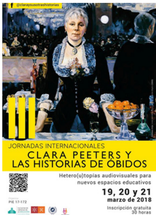
Fig.2. Jornadas Internacionales Clara Peeters y las Historias de Óbidos (Del 19 al 21 de marzo de 2018). Facultad de Ciencias de la Educación, Universidad de Málaga. Fuente: Alejandro Bravo Lara, diseñador del cartel.