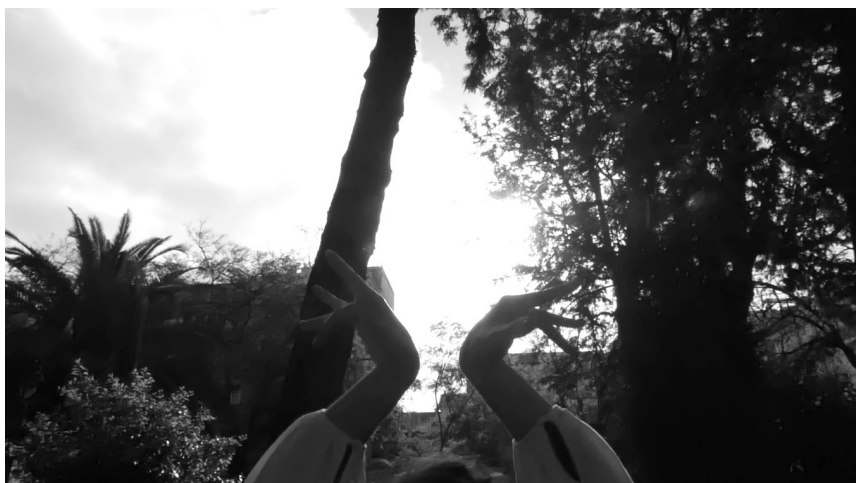
Fig. 3. Fotograma de Realidades Utópicas (curso 2017 / 2018).

Con la puesta en marcha de este proyecto, hemos intentado seguir la idea de Pagès (2009), en relación al desarrollo del pensamiento histórico que debería conducir a convertir al alumnado en pensadores reflexivos, críticos y creativos. Nuestro proyecto implica el fomento de un profesorado en formación inicial de Ciencias Sociales que tenga un perfil de profesorado historiador-artista que genere pensamiento crítico-creativo. Siguiendo a Santisteban (2010), el pensamiento crítico puede no ser creativo; pero el pensamiento creativo necesita ser crítico. Hoy más que nunca, vivimos en una sociedad que demanda la creatividad con fines comerciales, mostrándonos distopías y convenciéndonos de que podríamos estar mucho peor, así que, ¿para qué quejarnos?; pero la creatividad desde la Didáctica de las Ciencias Sociales debe recuperar su compromiso social y plantearnos, ¿qué mundo queremos y cómo podemos mejorarlo desde el proceso enseñanza-aprendizaje de las Ciencias Sociales?