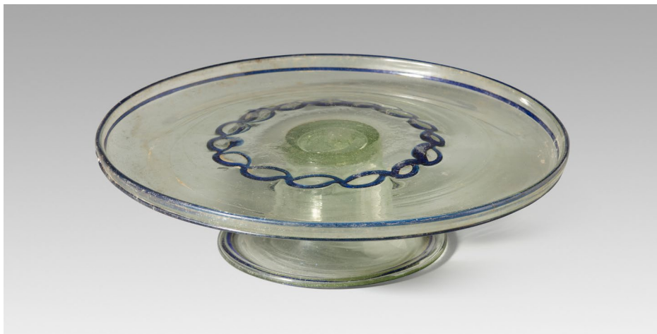
FIGURA 15. Servidora procedent de Cadalso de los Vidrios (Madrid), s. XVII.

La col·lecció Macaya va ser una de les vint-i-sis confiscades a la ciutat de Barcelona i va ser traslladada el setembre de 1936 al Palau Nacional. La numeració dels objectes arriba a 547, entre els quals es troben els vidres, la col·lecció de ceràmica i porcellana, les pintures i altres objectes. La documentació que conserva l'Arxiu del MNAC descriu objectes de vidre, objectes d'arqueologia de metall, joieria i terracota, mobiliari dels segles XVIII i XIX, pintura religiosa dels segles XVI i XVI, pintura sota vidre i dues escultures de fusta del segle XV. En un document encapçalat amb el títol: «Relació dels objectes diversos i col·leccions artístiques ingressats a la Comissaria General de Museus des del 19 de juliol de 1936 fins a la data», apareix la col·lecció de vidres amb la numeració 44.001–44.269, al costat de les col·leccions Amatller, Roviralta, Arnús, Capmany o la del Baró de Cruïlles, entre d'altres. El document està datat el dia 1 d'octubre, la qual cosa demostra que Gudiol es va preocupar primer de salvar els vidres i posteriorment ordenà retirar el resta d'objectes i d'obres que conservava Alfons Macaya a casa seva.