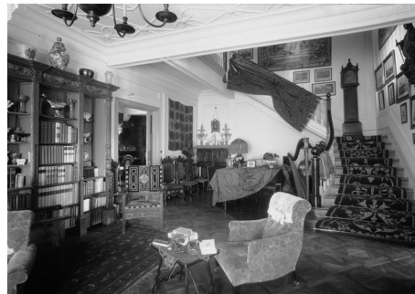
FIGURA 4 i 5. Autor desconegut. Interiors de la Casa Macaya. 1932. Arxiu Mas. Institut Amatller d'Art Hispànic.