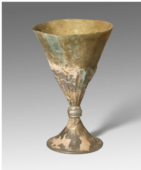
FIGURA 12. Copa procedent de Paterna, s. XIV.

Altres vidres púnics i d'època romana procedeixen de la important collecció Vives Escudero. L'acadèmic, arabista, arqueòleg, numismàtic, colleccionista i antiquari Antonio Vives Escudero (1859–1925) va construir importants colleccions d'objectes arqueològics, gran part de les quals es troben al Museo Arqueológico Nacional o al Museu de Menorca. Vives va vendre al Museo Arqueológico Nacional la seva gran collecció numismàtica i bronzes ibèrics en diversos ingressos, el 1891, el 1910 i el 1918, adquisició pagada per una subscripció popular i que no va ser l'única operació comercial que dugué a terme. 29 Vives, que rebé l'encàrrec l'any 1908 de redactar el Inventario monumental y artístico de las Islas Baleares , alhora que feia excavacions a Eivissa i Menorca, conjugava les seves tasques professionals al Monetario del Museo Arqueológico Nacional amb el comerç d'antiguitats, unes activitats que, si bé avui són del tot incompatibles, en aquells moments eren molt comunes.