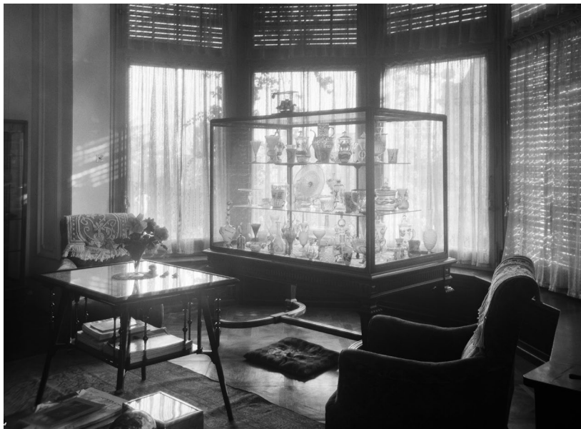
FIGURA 6. La sala de la planta baixa amb la vitrina de la col·lecció de vidres d'època moderna.