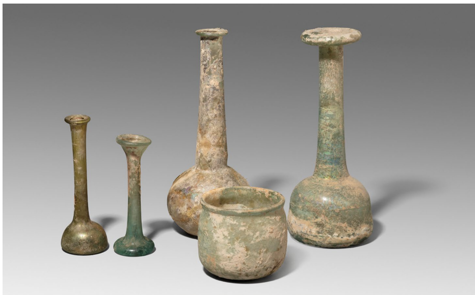
FIGURA 10. Conjunt de vidres romans procedents de Síria, s. I–III dC.