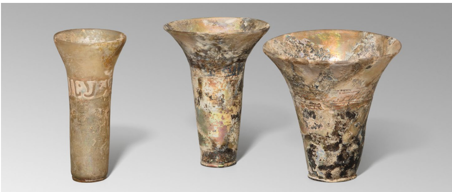
FIGURA II. Tres llànties islàmiques esmaltades procedents de Síria, s. XIV.