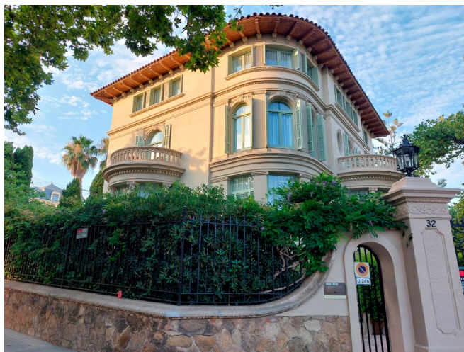
FIGURA 7. Casa Macaya. Avinguda del Tibidabo, 32. Barcelona.

Curiosament, la casa Macaya ha tingut també un paper important com a escenari de ficció literària, ja que va ser un espai protagonista del best-seller internacional La sombra del viento (2001), de Carlos Ruiz Zafón. La multipremiada i reeditada novel·la, amb més de quinze milions d'exemplars venuts i traduïda a trenta-sis idiomes, és una enginyosa mescla de relat d'intriga i de novel·la històrica que transcorre a la Barcelona de la primera meitat del segle passat. Un dels escenaris més importants de la novel·la és el palauet Aldaia, nom ficcionat de la casa Macaya i escenari dels amors del protagonista Daniel Sempere amb Beatriz Aguil. L'autor del llibre coneixia bé tots els racons d'aquesta casa i del seu jardí, a l'avinguda del Tibidabo, núm. 32, perquè hi havia treballat com a publicista els anys en què fou una de les seus de la firma Bassat & Ogilvy a Barcelona.