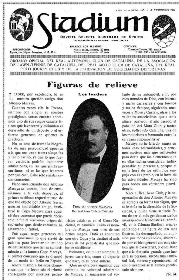
FIGURA 2. Portada de la revista Stadium del 17 de febrer de 1917.

Alfons Macaya fou molt actiu en l'origen de la pràctica de diversos esports, com el tennis, el golf, el ciclisme, el futbol o les carreres de cotxes, entre d'altres. Amb vint-i-dos anys ja era president de l'Hispania Athletic Club, entre 1900 i 1903, amb seccions de futbol i atletisme. Fou promotor de la Copa Macaya de futbol, precedent de la Copa Catalunya, i del primer torneig de futbol a tot l'Estat, també entre 1900 i 1903. Presidí la Federació Catalana de Tennis entre 1906 i 1909, el Club de Golf Terramar de Sitges entre 1927 i 1935 i el Reial Club de Tennis de Barcelona entre 1929 i 1935. 2