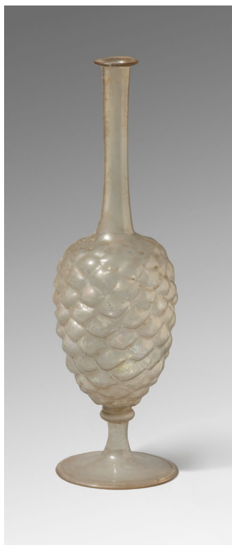
FIGURA 17. Ampolla procedent de Catalunya, s. XVIII.

Gràcies a la gentilesa dels nets del col·leccionista, els seus vidres han estat dipositats als Museus de Sitges per un període de quatre anys prorrogables. D'aquesta manera s'impulsa novament la idea original d'Alfons Macaya de facilitar l'accés de la col·lecció al públic. Si ja des d'abans de la guerra el col·leccionista la mostrava a les estances del seu domicili i la donava a conèixer a través de la publicació i difusió del seu catàleg, ara es podrà veure a les sales