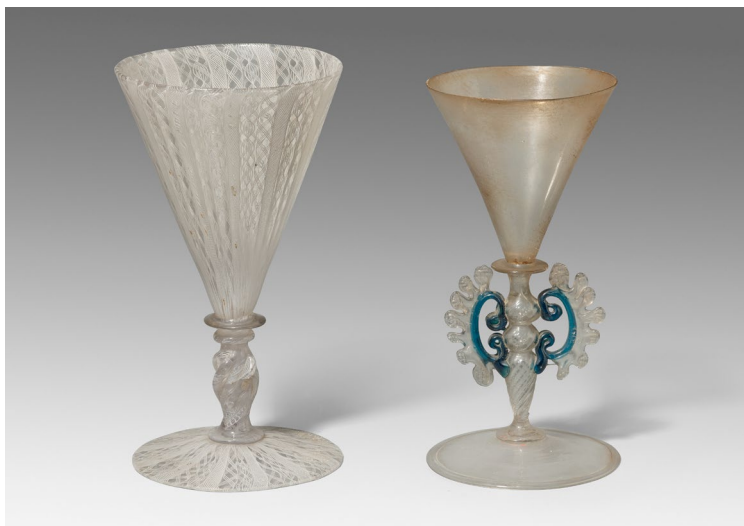
FIGURA 16. Dues copes procedents de Venècia, s. XVII.