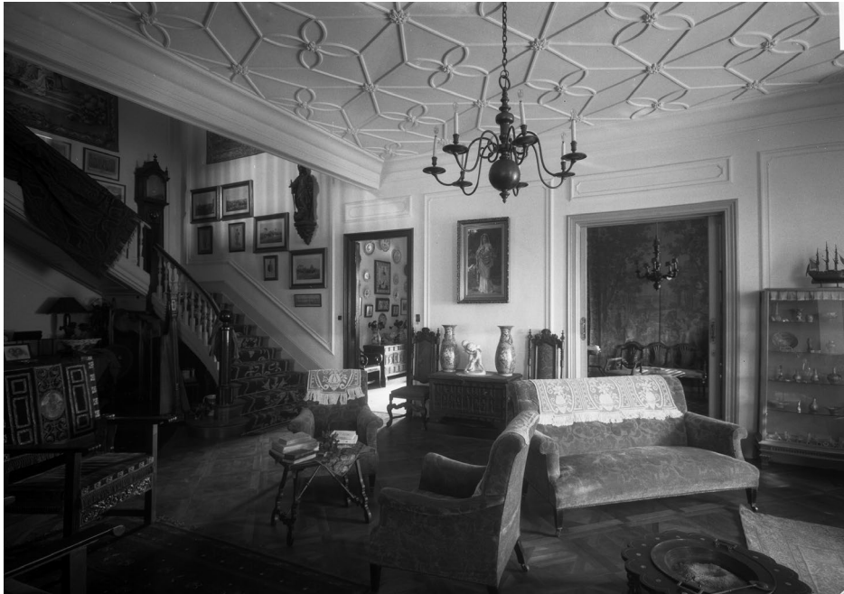
FIGURA 8. Autor desconegut. Sala de la planta baixa. A l'esquerra, una de les vitrines de vidre antic. 1932.