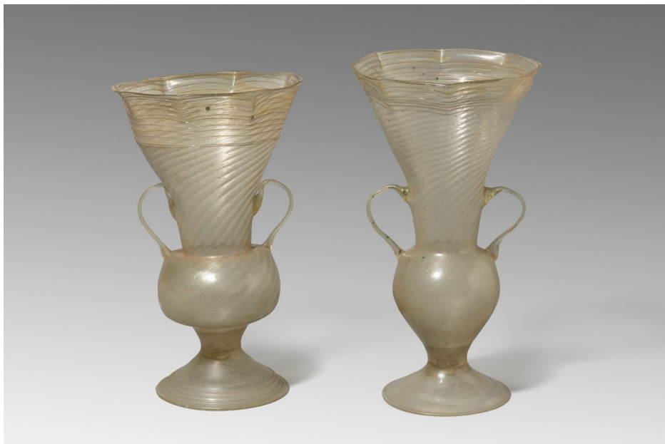
FIGURA 14. Dos gerros procedents d'El Recuenco (Guadalajara), s. XVII.

Al cap de poc temps que les col·leccions d'Alfons Macaya fossin requises pel govern de la Generalitat, la casa fou ocupada pel POUM i l'any 1937 s'hi instal·là temporalment Dolores Ibárruri, la Passionària. La ubicació de la casa lluny del centre de la ciutat, llavors bombardejada sistemàticament per l'aviació italiana, en feia un lloc segur i tranquil on instal·lar la dirigent comunista. Segons ens expliquen els descendents d'Alfons Macaya, en acabar la guerra, va quedar a la casa diversa documentació de la dirigent, com cartes personals i familiars, a més de documentació política, papers que Alfons Macaya va entregar a la policia.