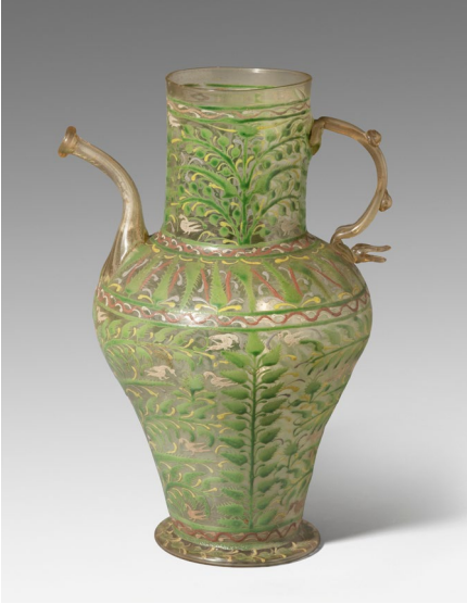
FIGURA 13. Aiguamans. Vidre esmaltat, Catalunya (probablement Barcelona), segona meitat del s. XVI.

Un cas similar és el dels vidres procedents de Baalbek (Líban), que apareixen com a provinents de la col·lecció de M. Alouf. Michel M. Alouf va ser conservador de les ruïnes de Baalbek i entre les seves publicacions cal destacar Histoire de Baalbek , editada per primera vegada al Líban l'any 1890 i reeditada en francès i anglès diverses vegades fins a arribar a més de trenta edicions a mitjan segle passat. 30