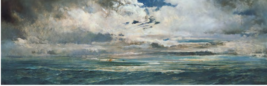
FIGURA 18. Ramon Martí i Alsina, Marina . Oli sobre tela, 60,9 × 173 cm. Núm. d'inventari 132. Col·lecció BBVA. Aquesta obra va estar a la Sala Parés el juny de 1969, segons l'etiqueta del dors.

Ferran Benet té avui una magnífica col·lecció de pintures de Colom, que va fent amb els anys. Benet, jugant fort damunt la carta delicada de l'amistat, no s'ha pas errat. Ferran ha fet pujar la cotització de la pintura de Colom d'una manera respectable. Actualment Colom és un dels nostres pintors que més es paguen. Heus ací com no sempre els sentiments s'equivoquen [...] Visca la bona fe fins i tot en el colleccionisme. 88