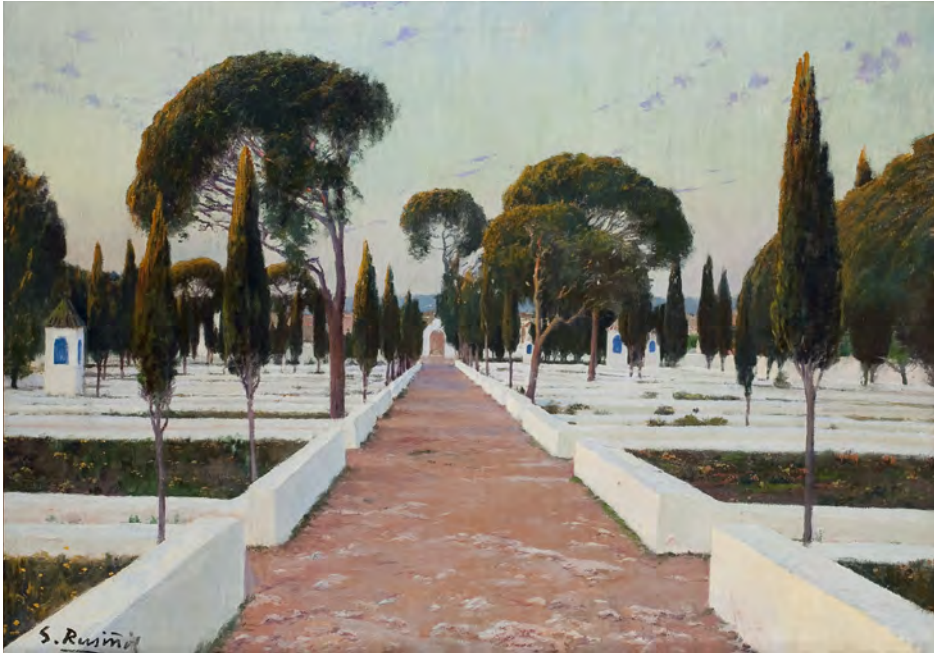
FIGURA 8. Santiago Rusiñol, Calvari de Bètera, II , 1910. Oli sobre tela, 88 x 122,5 cm. Signat «S. Rusiñol» a l'angle inferior esquerre. Col·lecció particular.