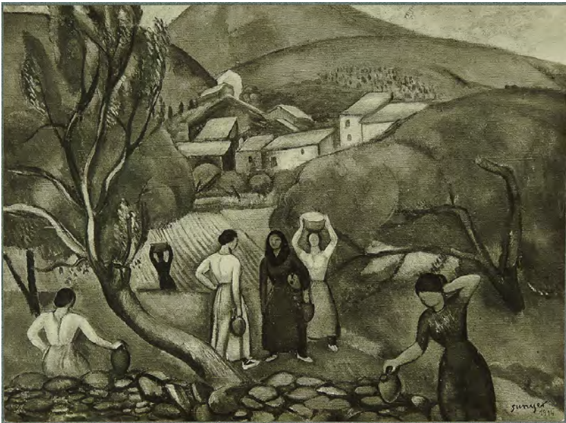
FIGURA 9. Joaquim Sunyer, Puig del Mas , 1914. Oli sobre tela, 73 x 93 cm. Signat «Sunyer» a l'angle inferior dret. Col·lecció particular.