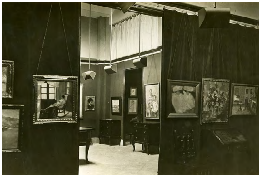
FIGURA 13. Francesc Serra Dimas, Exposició de la collecció de Fernando Benet a les Galeries Laietanes , octubre de 1930. Fons Francesc Serra Dimas. Arxiu Fotogràfic de Barcelona.

leccionista, al qual l'unia l'amor per la pintura. En el text, Pujols reconeixia Fernando Benet com a colleccionista pintor: