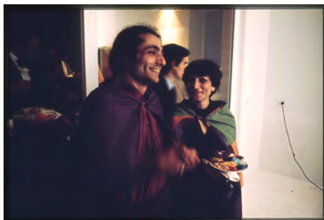
FIGURES 9 i 10. Festa ritual Situació Color , 1976.

Va ser el ritual d'iniciació a una nova manera de viure, concebut com un viatge iniciàtic escenificat en el recorregut a través de les diferents estances i pisos de l'habitatge, definits pels tres colors secundaris: violat, verd i taronja. Al rebedor, Sisa animava la investidura, consistent en la missió d'unes donzelles cobertes amb vels de color violat, que guarnien els convidats amb unes capes del mateix color. Un color que, per art de màgia o, millor dit, per la màgia de l'art, havia pigmentat les begudes i el menjar. A la mateixa planta s'accedia a la cuina, oberta als convidats, on l'aigua corrent que rajava de l'aixeta era de colors: òbviament, blava la freda i vermella la calenta. A més, sobre els fogons hi havia emplaçat un televisor que proposava un vídeo en què apareixia Antonio, el cap del servei domèstic, queixant-se que el senyor sempre dei-