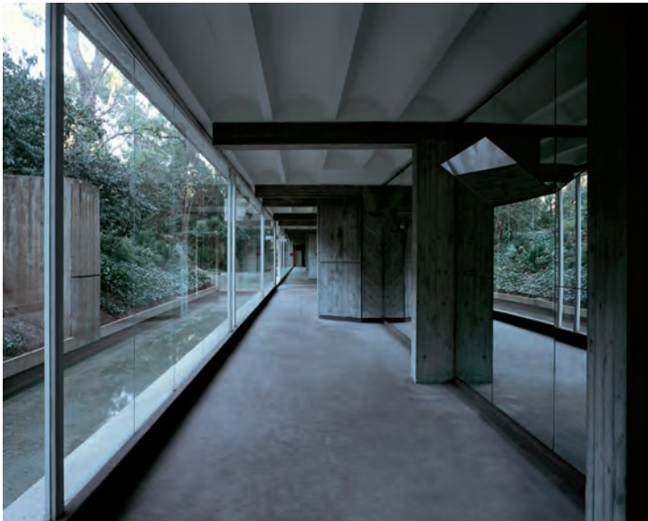
FIGURA 7. Vestíbul de Les Escales.

El complex Les Escales Park va ser projectat per Josep Lluís Sert en col·laboració amb Josep Zalewski i Jaume Freixa el 1967. Aquests arquitectes van dissenyar únicament el primer bloc d'edificis, que va ser construït entre 1971 i 1973. Els altres edificis es van construir més tard modificant el concepte original del projecte. El bloc originari s'estructura sobre un esquema de volumètries i altures asimètriques, amb una composició de buits rectangulars de diferents altures i profunditats, dins d'un entramat rectangular de pedra blanca. A la modernitat americana d'edifici d'habitatges dúplexs a l'estil de Le Corbusier, s'hi van incorporar elements típics de la tradició catalana, com les persianes de llibret, els sostres de bigues i revoltó o la ceràmica vidriada que proporciona el contrast de color característic d'aquest edifici.