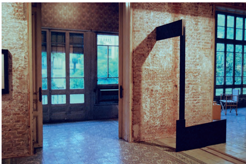
FIGURA 13. Espai Passeig de Gràcia 98 abans de la reforma, 1992.