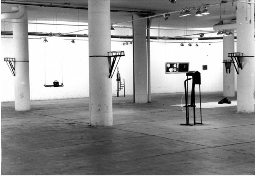
FIGURA 4. Exposició «Juan Muñoz». Galeria Vijande, Madrid, 1984.