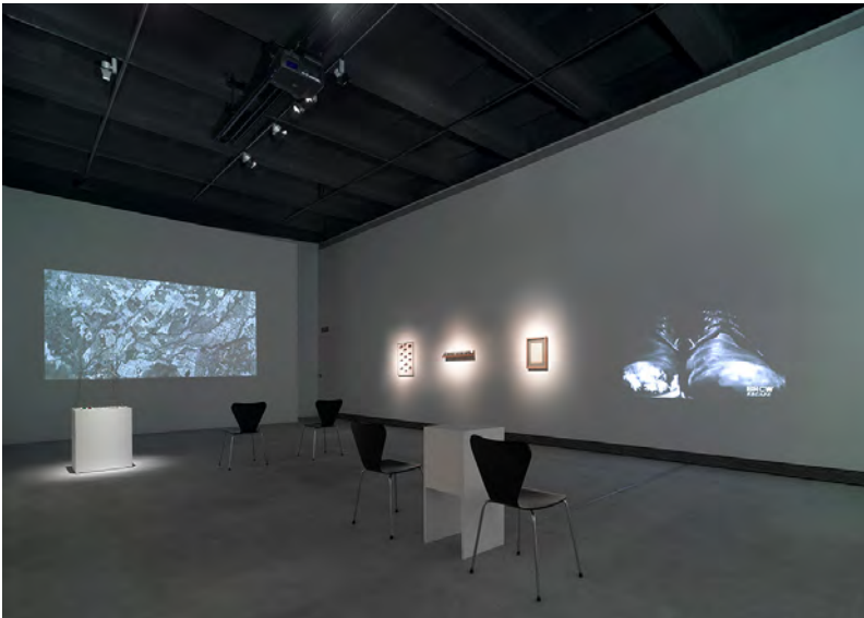
FIGURA 14. Exposició al Nivell Zero de la Fundació Suñol el 2008.

Com a complement d'aquesta programació, es va crear el Nivell Zero, un espai contigu situat al pati interior d'illa i amb accés des del carrer de Roselló. Dedicat a la creació emergent i contenidor d'activitats multidisciplinàries, va constituir un punt de referència de la ciutat en matèria de creació contemporània. Segons va explicar Suñol mateix, va pretendre donar a aquest espai una coherència i el mateix esperit de risc i innovació que havia aplicat a la compilació de la col·lecció. 11