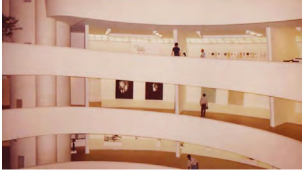
FIGURA 6. «New Images from Spain». Guggenheim Museum, 1980.

per l'Acadèmia Espanyola a Roma, i que proposaven artistes de generacions anteriors, cosa que establia un desfasament entre la realitat interior i allò que es projectava fora com a art espanyol actual. L'any 1980, després de quaranta anys d'aïllament, la cultura espanyola desitjava mostrar-se universal i europea, buscant un reconeixement exterior, però sense pretendre convertir-se en una derivació de l'avantguarda internacional.