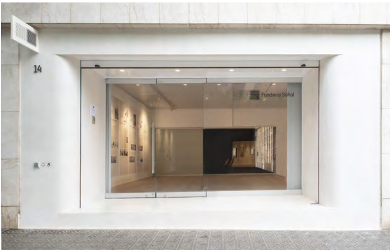
FIGURA 15. Fundació Suñol. Galeria 2 a les Corts.