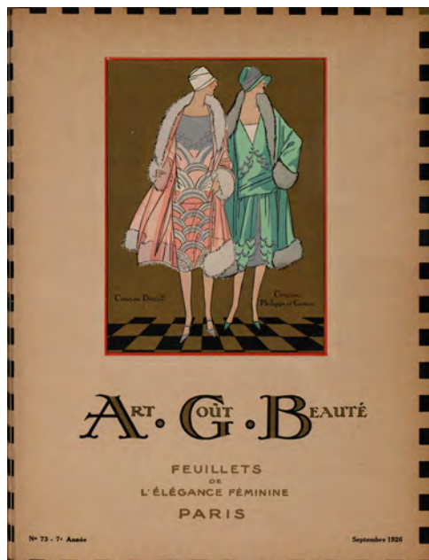
FIGURA 14. Autor desconegut. Làmina il·luminada au pochoir , coberta de la revista Art, Gout, Beauté , núm. 73, setembre de 1926, Centre de Documentació del Museu del Disseny de Barcelona.