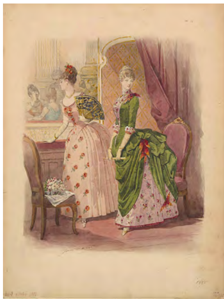
FIGURA 8. Jules David (dibuixant). Dibuix a l'aquarel·la, 1885, Centre de Documentació del Museu del Disseny de Barcelona.

A part dels autors notoris que s'han anat recordant fins ara, no es pot deixar d'esmentar Jules David, que també va ser molt prolífic i és especialment conegut perquè va dibuixar totes les làmines de Le Moniteur de la Mode des de