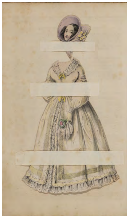
FIGURA II. Vestit de nina encartat dins la revista Psyché: Journal des Modes, Littérature, Théâtres et Musique , núm. 255, abril de 1839, Centre de Documentació del Museu del Disseny de Barcelona.