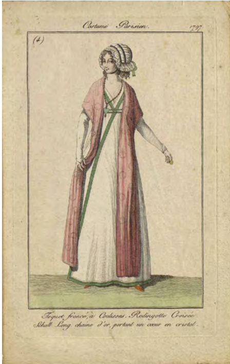
FIGURA 3. Autor desconegut. Gravats il·luminats a mà, revista Journal des Dames et des Modes , 1797, Centre de Documentació del Museu del Disseny de Barcelona.

quals s'ha identificat el període 1802–1831. També hi ha unes poques làmines datades de 1797, que són excepcionalment peculiars (figura 3). 38