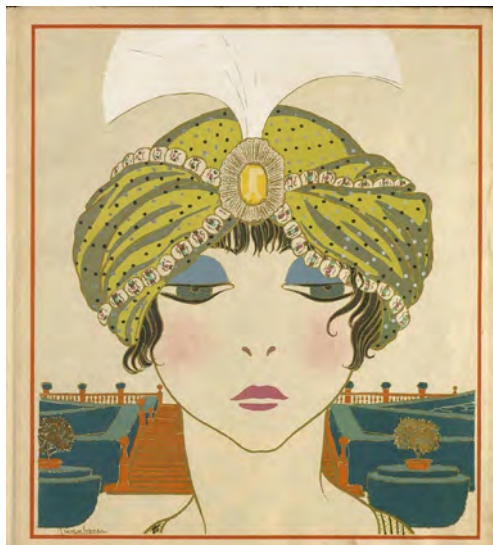
FIGURA 9. Georges Lepape (dibuixant). Gravat il·luminat au pochoir , àlbum Les choses de Paul Poiret vues par Georges Lepape , 1911, Centre de Documentació del Museu del Disseny de Barcelona.

Malgrat l'auge de la fotografia, a principis del segle XX es va viure un breu ressorgiment de les làmines de moda amb un marcat estil art déco ; les publicacions de luxe capdavanteres foren Gazette du Bon Ton o Art, Goût, Beauté: Feuillet de l'Élégance Féminine . Carmen Gil, tot i posseir nùmeros d'aquestes revistes — com es veurà en l'apartat següent —, no tenia estampes enquadrades a part. Aquesta mancança la suplí amb escriure comprant un important llibre de làmines que no podem deixar d'esmentar. Es tracta de Les choses de Paul Poiret vues par Georges Lepape , editat a París el 1911 per Maquet (figura 9).