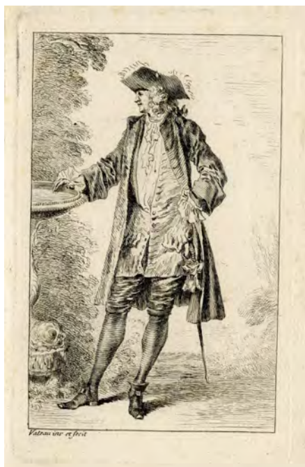
FIGURA 2. Jean-Antoine Watteau (dibuixant i gravador). Gravats a l'aiguafort de la sèrie Figures de modes , retocat al burí per Henri Simon Thomassin, 1735, Centre de Documentació del Museu del Disseny de Barcelona.

En el cas de les Figures de modes (figura 2), que podrien haver estat realitzades cap a 1710, 29 es disposa de la sèrie completa, formada per vuit làmines (incloent-hi el frontispici) 30 que tenen la particularitat d'haver estat gravades pel mateix Watteau, amb retocs al burí de Henri Simon Thomassin; consisteixen en quatre figures masculines i tres de femenines.