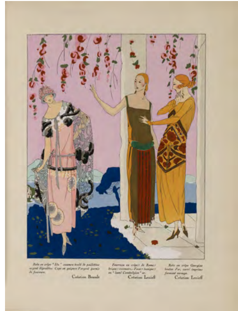
FIGURA 15. Autor desconegut. Làmina il·luminada au pochoir, revista Art, Goût, Beauté, núm. 35, juliol 1923