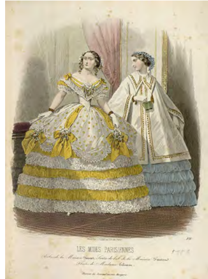
FIGURA 5. François-Claudius Compte-Calix (dibuixant). Dibuix a l'aquarella, 1859, Centre de Documentació del Museu del Disseny de Barcelona. FIGURA 6. François-Claudius Compte-Calix (dibuixant) i F. [il·legible] (gravador). Gravat il·luminat a mà, revista Les Modes Parisiennes , 1859, Centre de Documentació del Museu del Disseny de Barcelona.