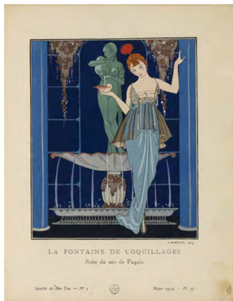
FIGURA 12. George Barbier (dibuixant). La fontaine de coquillages: robe du soir de Paquin , làmina il·luminada au pochoir , revista La Gazette du Bon Ton , núm. 3, març 1914, Centre de Documentació del Museu del Disseny de Barcelona.