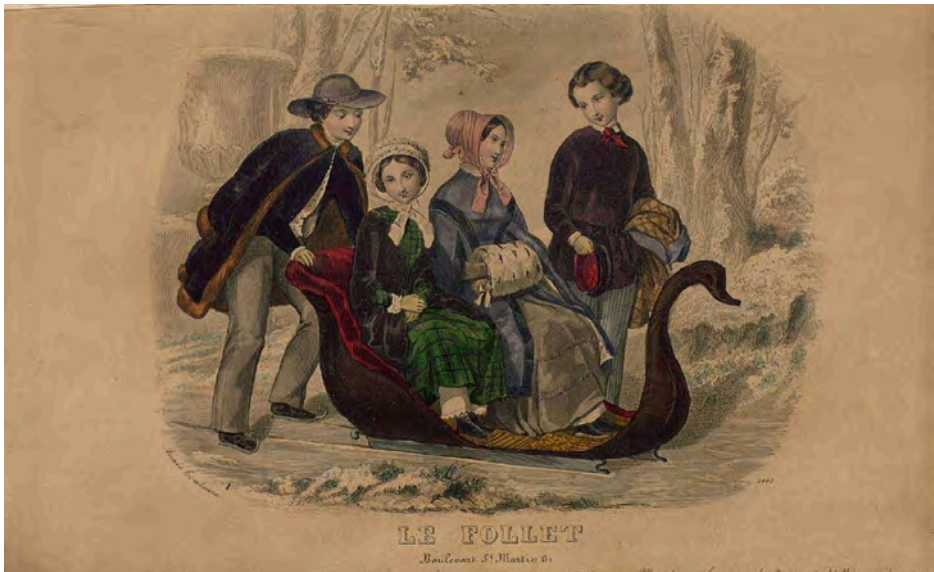
FIGURA 7. Anaïs Toudouze (dibuixant). Gravat il·luminat a mà, revista Le Follet , segle XIX, Centre de Documentació del Museu del Disseny de Barcelona.