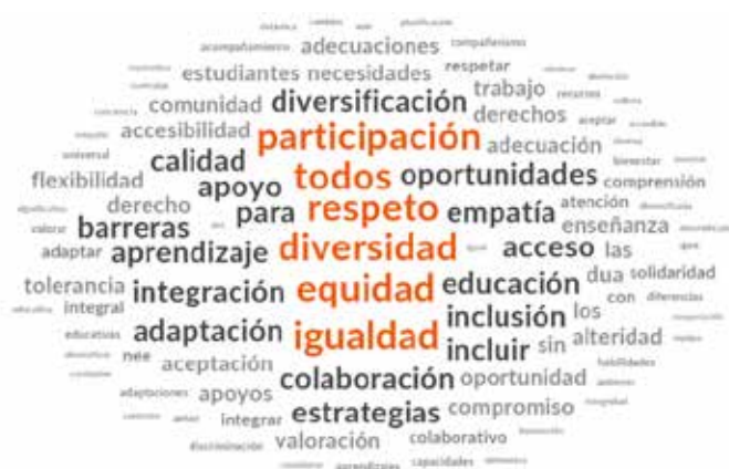
Nube de palabras. Concepto de educación inclusiva de los profesores en formación