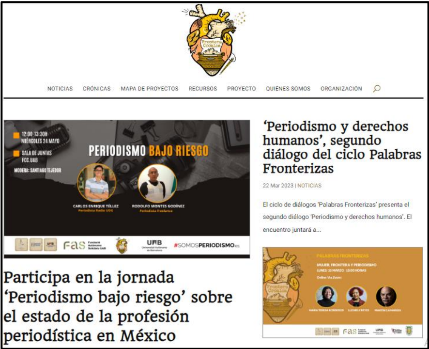
FIGURA 2. Sitio web del proyecto Frontera Crónica