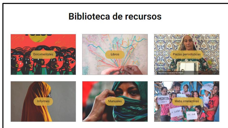
FIGURA 4. Biblioteca de recursos para periodistas