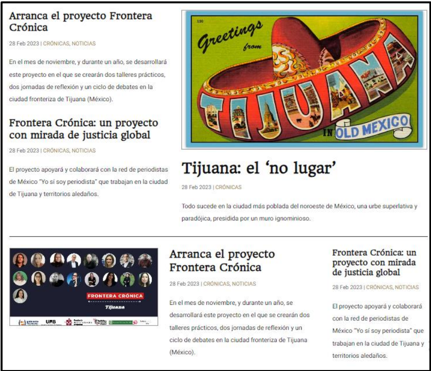
FIGURA 5. Reportaje sobre Tijuana y sus fronteras

sido igualmente recogidas en el libro general del proyecto que se mencionaba anteriormente (Tejedor, 2023).