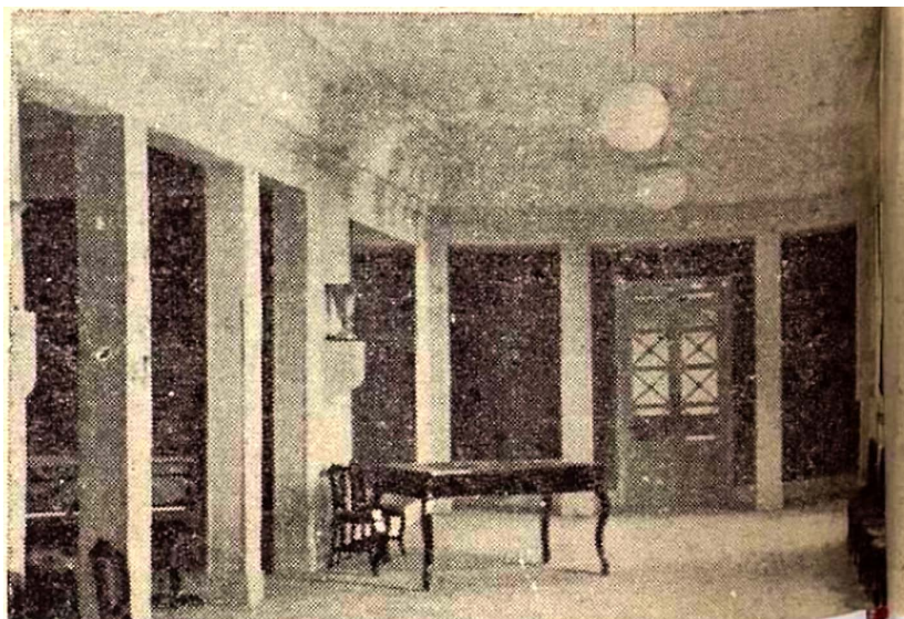
Figura. 5. Aula de danza del Real Conservatorio de Madrid.