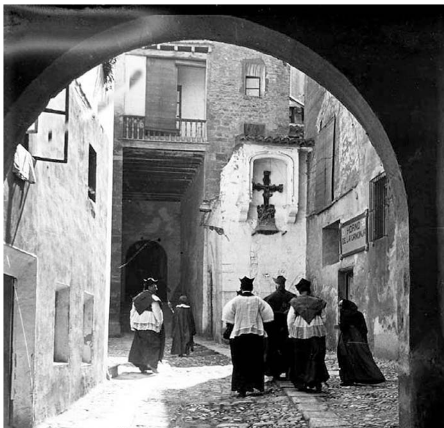
Fig. 3. Placeta de Palau o de la Canonja, con la puerta de acceso al claustro de la catedral de Tortosa. Fotografía: J. Salvany, 1914 (Biblioteca de Catalunya, fons Salvany).