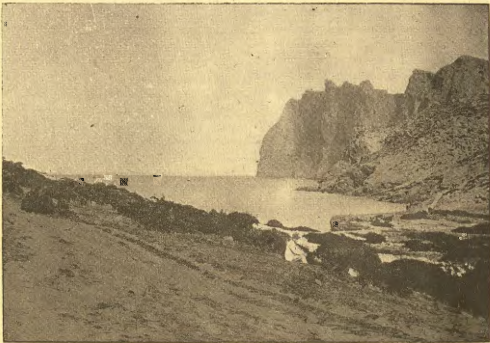
Pollensa (Mallorca) Cala de Sant Vicéns