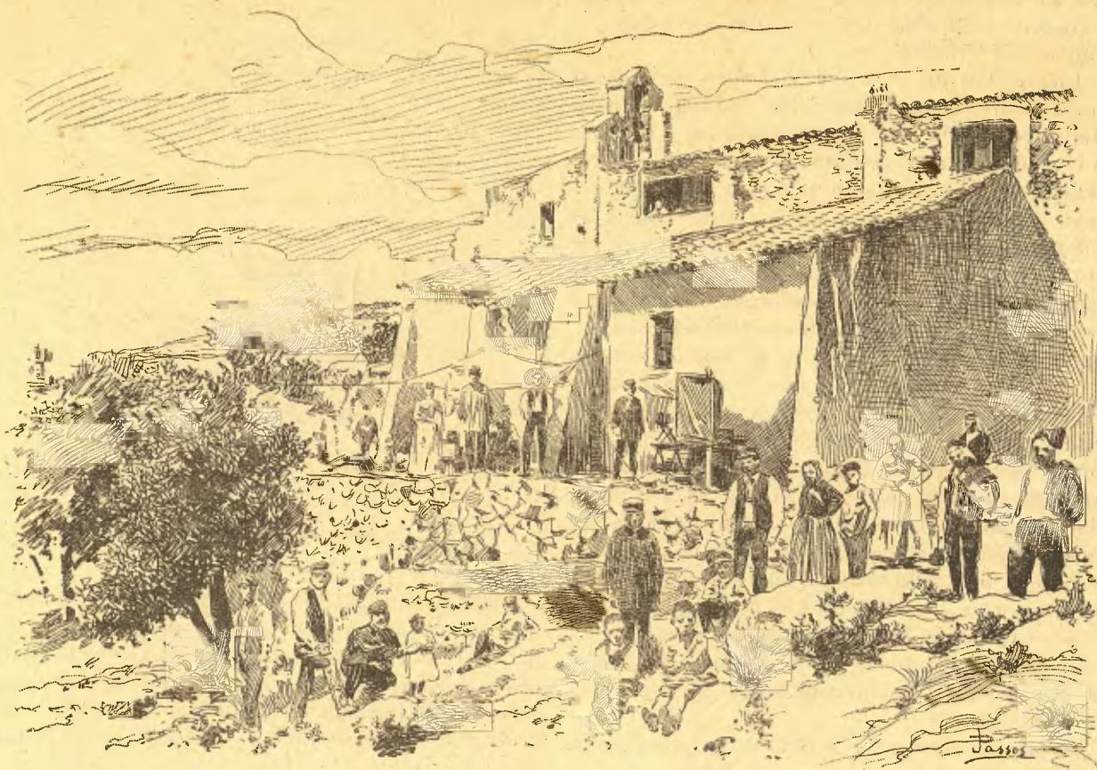
SITGES.—ERMITA DE LA TRINITAT