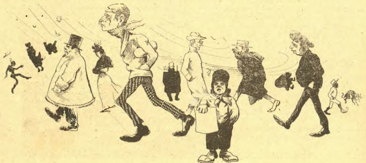
La cayguda de la fulla