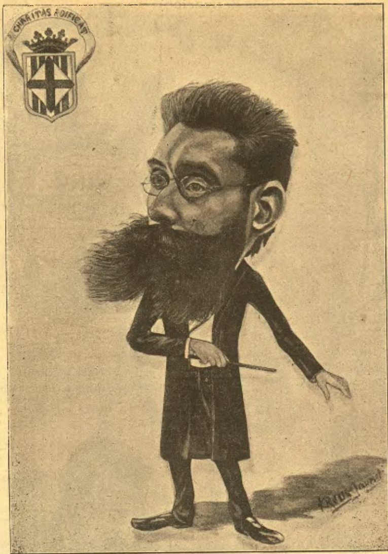
EL MESTRE GUITERAS ( dibuix de Creus )