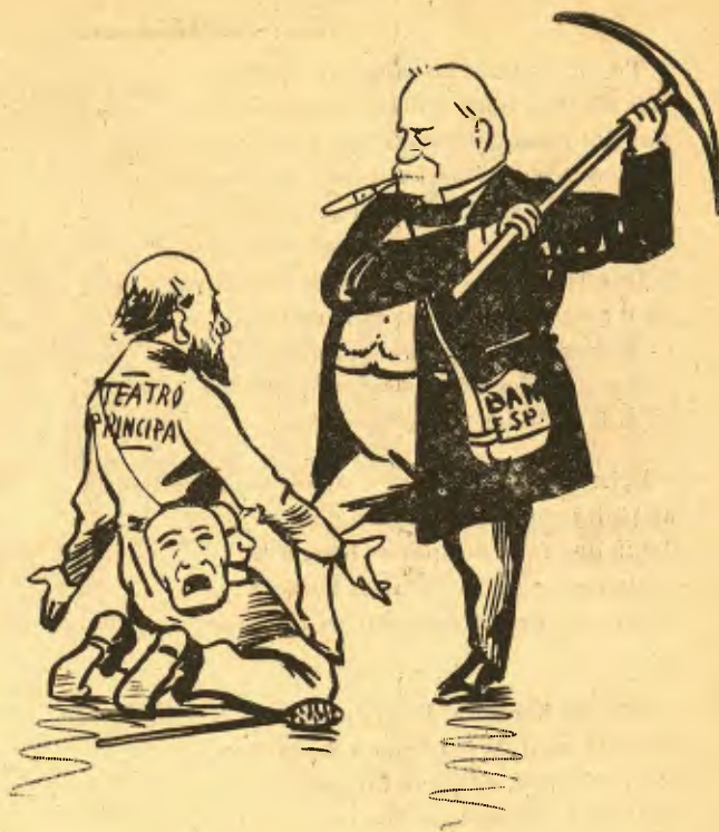
EL TRIUNFO DEL BADELL D' OR. Títol del últim dra- ma que 's representarà en el Principal.