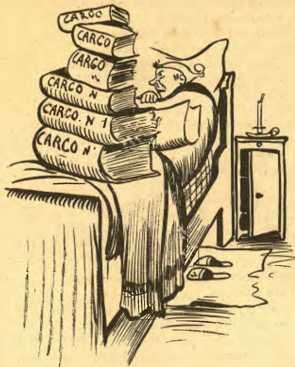
El somni d' un regidor, després de la marxa d' en Golfín.