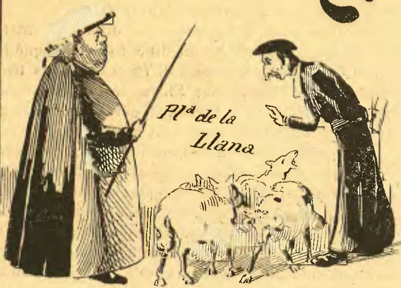
Pla de la Llana