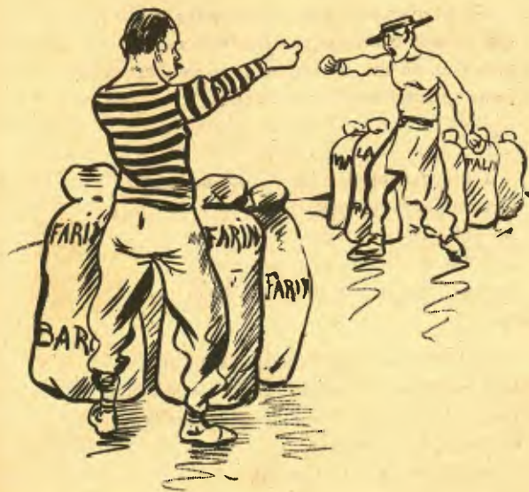
Els forners de Barcelona clamant contra 'ls seus confreres malaguenys per l' acu- sació de lo de la BARITA.