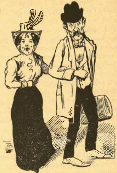
Cuán tornan, venen cruixits buyts de butxaca y malalts.

Si be es veritat que las plantas totas se componen de 14 cossos senzills, ens ocuparém solsament dels que l' horticultor deu considerar com elements ó aliments essencials é indispensables á la vegetació, com son l' azoe , l' acit fosforich , la potassa y la cal .