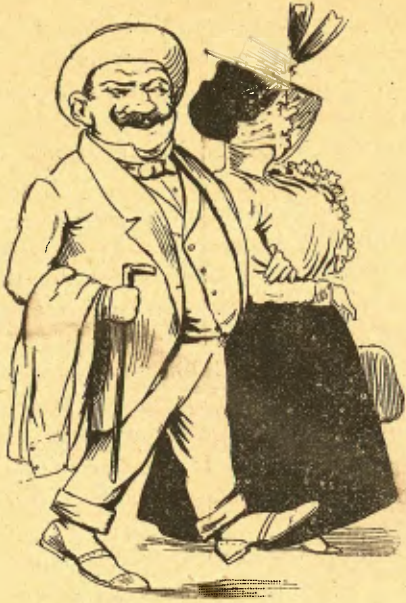
Se 'n van á fora, aixerits, sanitosos y jovials...