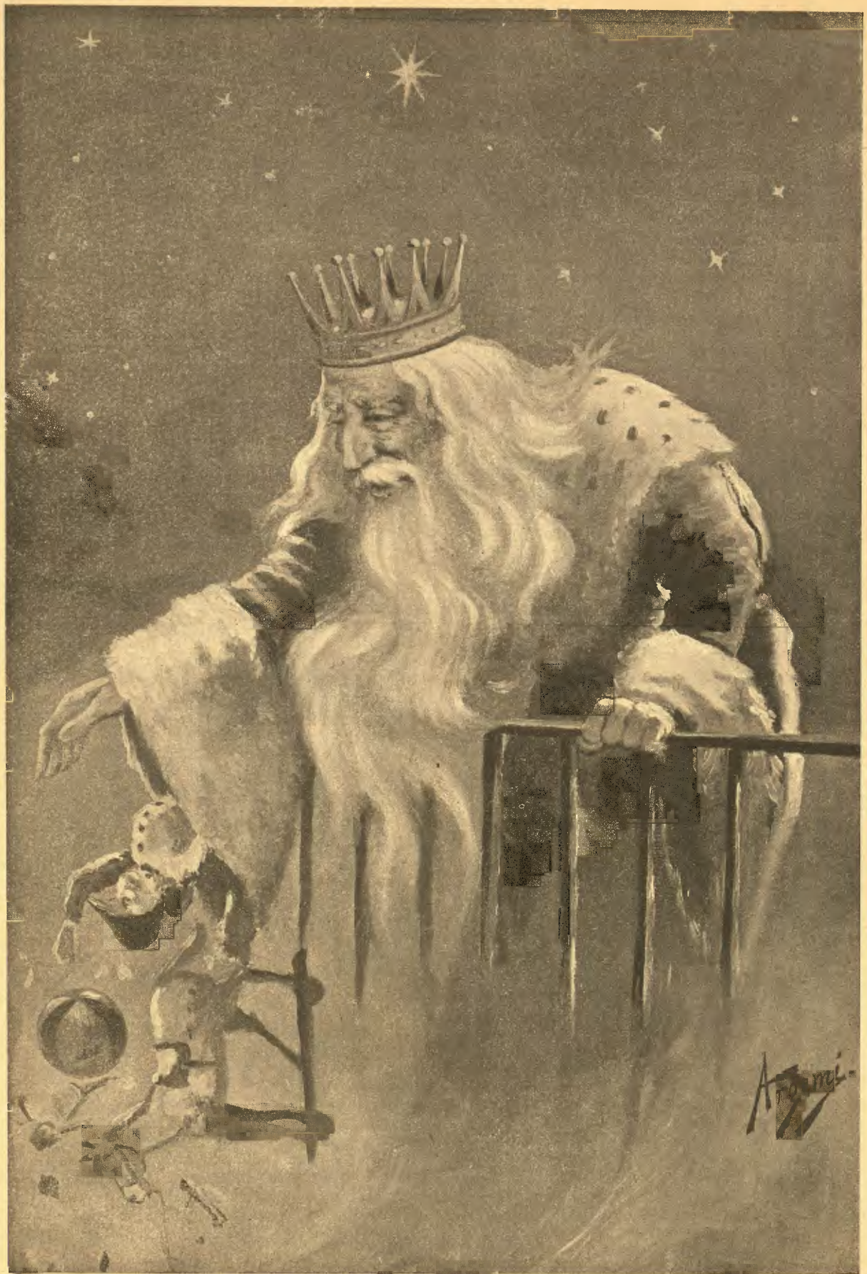
ALEGORIA DE REYS