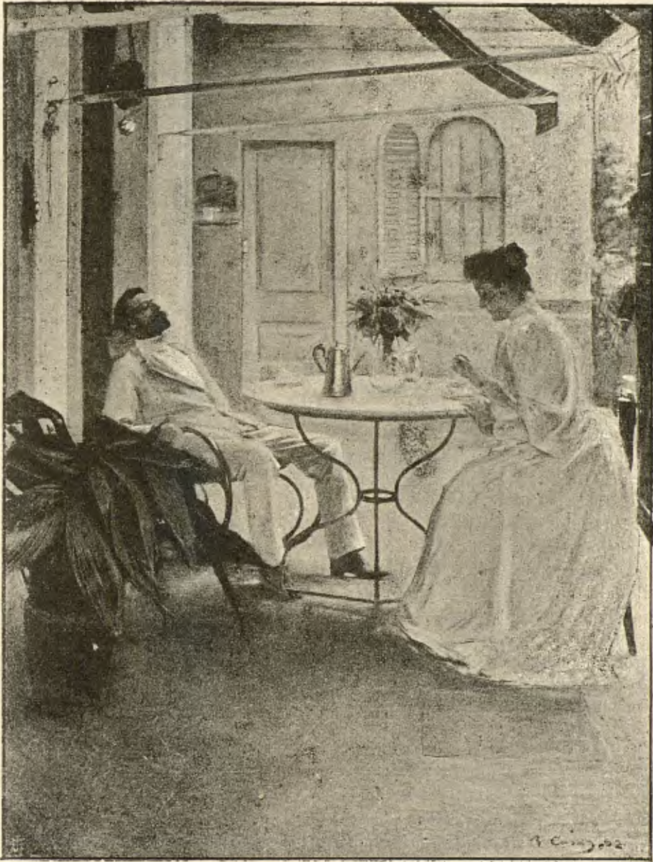
ESTIUHEJANT (Cuadro de Ramón Casas).