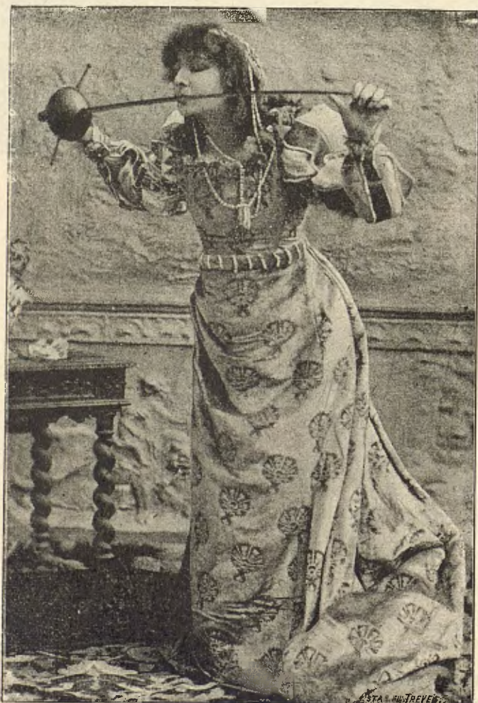
SARAH BERNHARDT EN «LA DAME DE MALLANT».