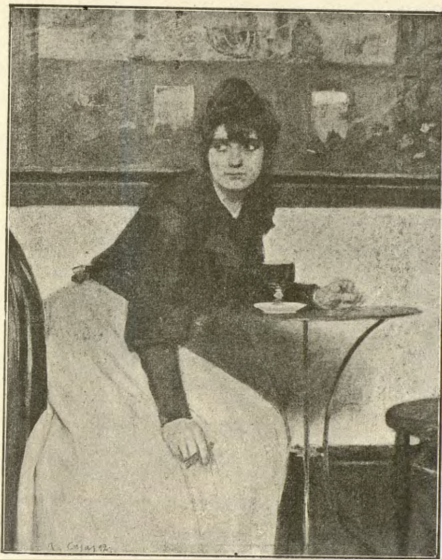
EN EL « MOULIN DE LA GALETTE », DE PARIS (Cuadro de Ramón Casas).

conmemoratiu de nostre primer Certamen literari-musical, que forma un veritable tomo poètic y conté 42 retratos.