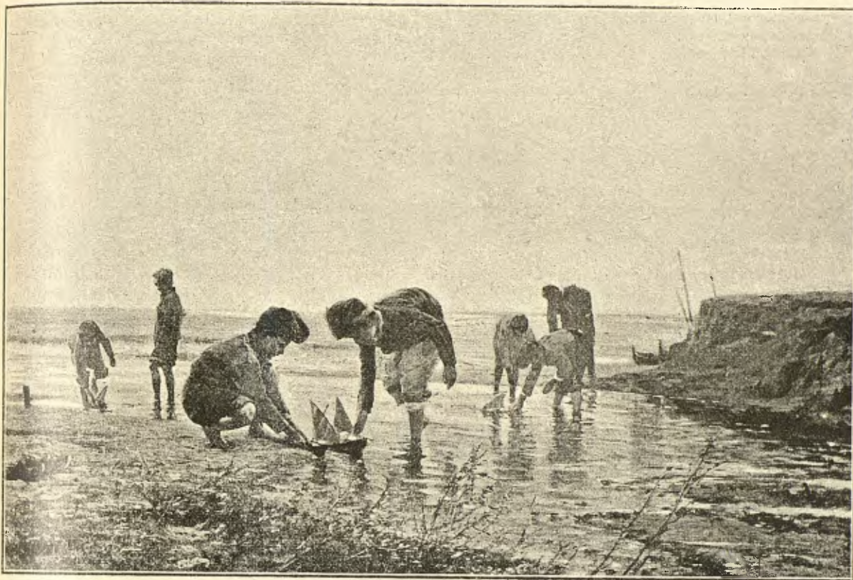
EN LA PLATJA (Cuadro de Modest Teixidó).