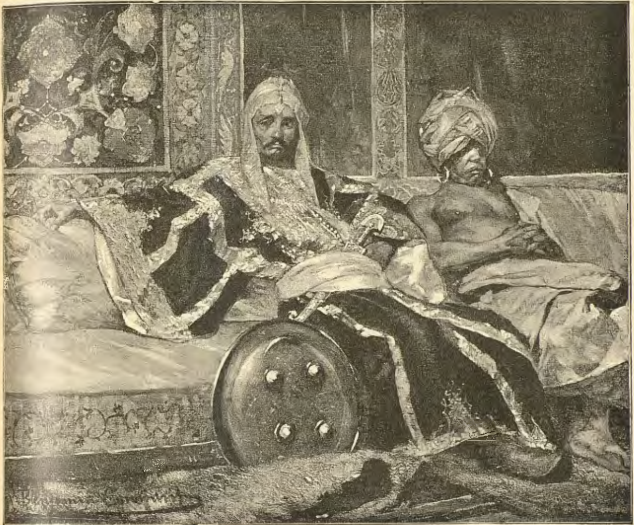
GENIZAR Y SON EUNUCH (Cuadro del célebre Benjamí Constant)

d'hivern devia pagar el seu crim en el pati dels Corders.