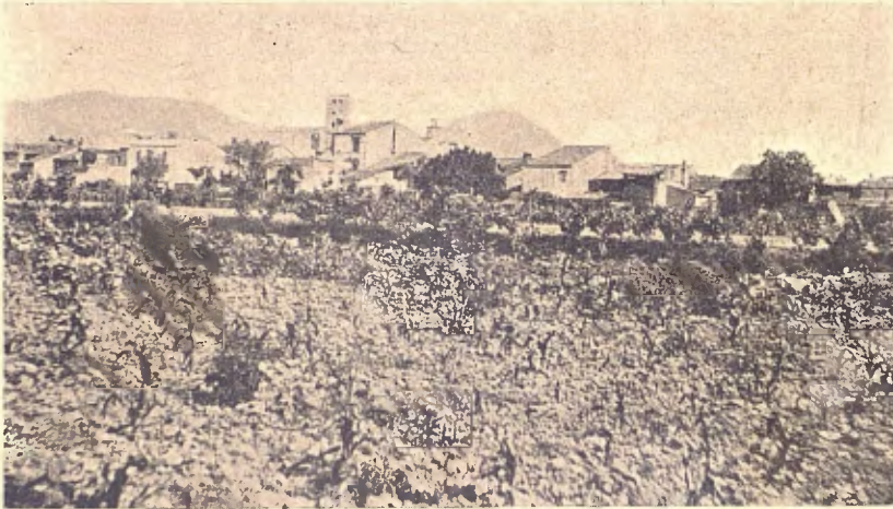
Vista general de Breda

Actualment l' iglesia del monastir serveix de parroquia á la vila. La grandiositat de sa nau, d' istil gotich, demostra ben be tota l' importancia que tingué 'lmonastir en la civilisació antiga.