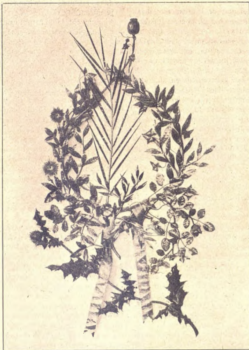
Corona dedicada á Mossen Cinto, per iniciativa del "Catalunya Nova".