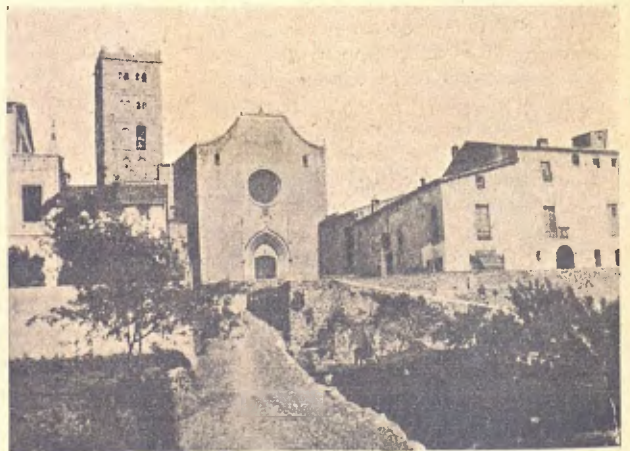
Breda. Monastir de Sant Salvador

En una de las moltas correrías que feu l' exercit francés per aquells encontorns durant