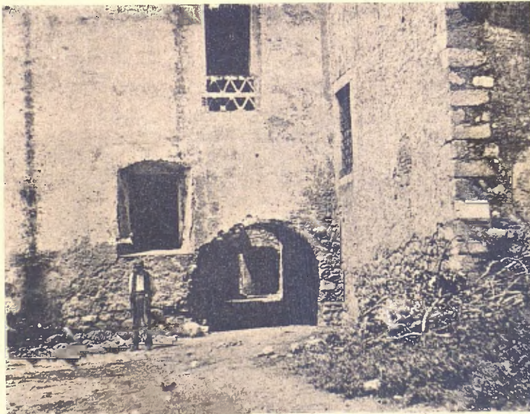
Breda Antich Sagrat del Monastir

En algunas casas hi ha colocats en els portals uns guarda-rodas, sent aquestos, trossos de marbre procedents de las pilastras dels claustres, y per últim, com si servís de escarni, en una casa de la plassa, situada á ma esquérra, tenen aparexada servint de obi pera abeurar lo bestia, una d'aquellas urnas sepulcrales quina potsé había guardat las despullas