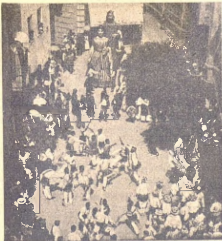
Recort de la Festa Major de Sitges