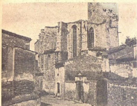
Detall del absis del Monastir

la guerra de l' Independencia, saqueijaren el convent y després d' haver malmés l' orga, s' emportaren las campanas, fent lo mateix ab las de l' iglesia de Santa María, sumant juntas lo número de disset, deixant solsament las del rellotje quinas no pogueren abastar per estar colocadas á dalt de tot de la torre.