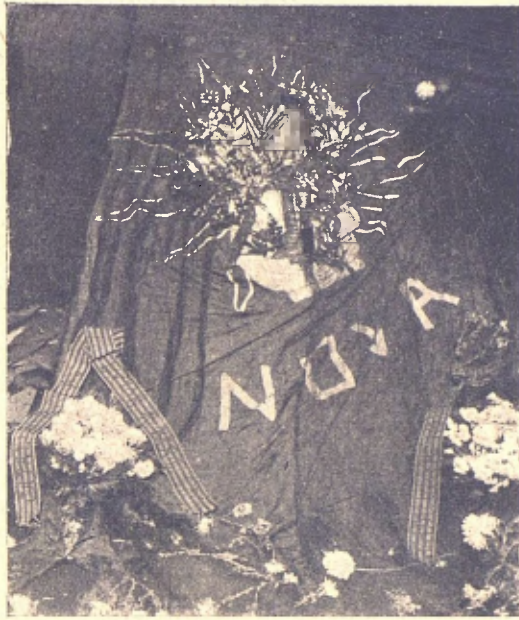
Vista de la corona exposada al local de "Catalunya Nova"

Passat algun temps la miseria li obrí las portas de bat á bat, y l' Alfons que fins allavors