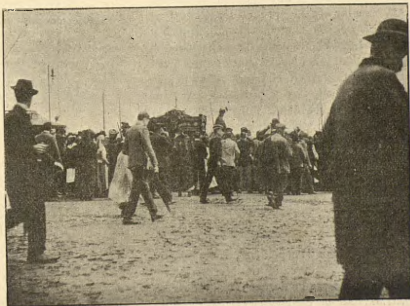
1. La multitud enfilada en el monumnt á Colon.— 2. Camí del Cementiri.

gatzara que precedian á sa entrada, portat cada hú del afany de colocarse lo més aprop possible del malalt nou , apilotántnos tots en tamborets y cadiras y enfilántnos á falta d'altre cosa, á sobre dels llits dels voltants, no sens protesta dels pobres malalts atropellats y mitj sofocats per aquells improvisats anfiteatros. Y era que no volíam perdre una sílaba de la llissó y ensemps que'ns atropellavam, mútuament ens servíam d'escambell pera veurer millor, escoltant la paraula del mestre ab un reculli-