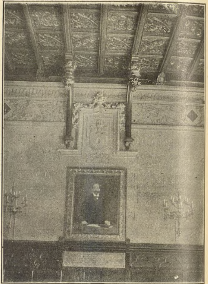
SITGES.—Testero del Consistori hont hi ha el retrato de'l Dr. Robert.

Era á Lisboa despedintme dels amichs literats que m' ajudan en mos treballs biográfichs á la Revista , cuan va arribarme la desconsoladora nova, pregonada per la veu xisclayre dels baylets venedors de diaris. L' impressió fou indescriptible, y tant á mí com als amichs ens va deixar aclaparats... Tots, en expontánia y hermosas mostrás de condol, m' han fet avinent que dongués á coneixer desde las planas