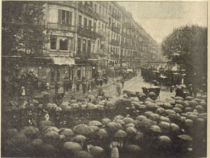
Devant del carrer de Pelayo.

La premsa hi estava representada pe'ls periodichs: La Veu de Catalunya , Diario de Barcelona , La Renaixensa , El Noticiero Universal , La Vanguardia , El Liberal , Diario del Comercio , Diario Catalán , Joventut , La Universitat Catalana , ¡ Cu-cut! y la Redacció de CATALUNYA ARTÍSTICA, de Barcelona, y La Veu del Segre , La Veu del Vallés , La Veu de Torto-