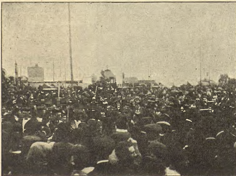
1. Al devant del Banch de Barcelona.—2. Prop del monument á Colón.

Malgrat que alguns cabells blanchs nos indiquin qu' estém ja un xich lluny d' aquells felissos anys de la primera joventut, recordém encara ab l' intensitat d' un present las horas que á la cátedra y á la clínica passarem junts ab nostre mestre inoblidable. Tots els que hem tingut la sort d' esser sos deixebles, guardém com preuhadora reliquia las notas presas de sas explicacions orals, notas que malgrat que fetas á corre-cuyta, servint els genolls de pupitre, incongruentas á vol-