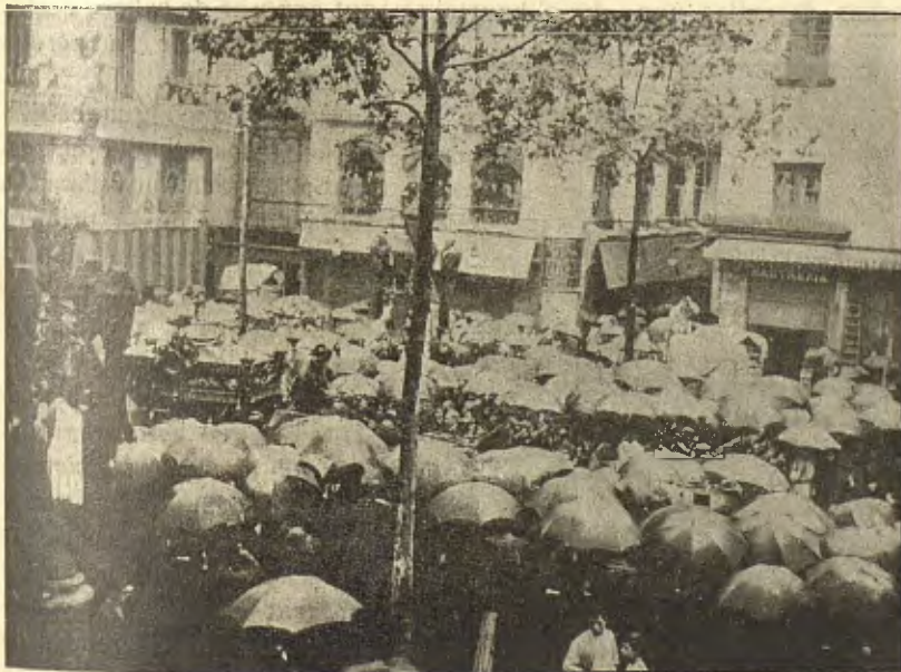
1. El corteig en la Rambla de las Flors.—2. En el Plá de la Boquería

Després... va procedirse al enterrament. S' obri