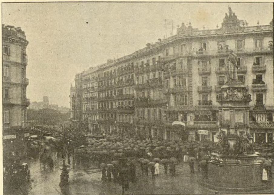
Rambla de Catalunya.— Voltants de la casa mortuoria.