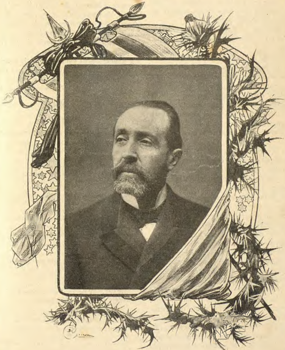
Dr. D. Bartomeu Robert

Nat a Tampico (Méjich) el 19 d' Octubre de 1842 † a Barcelona la nit del 10 d' Abril de 1902.