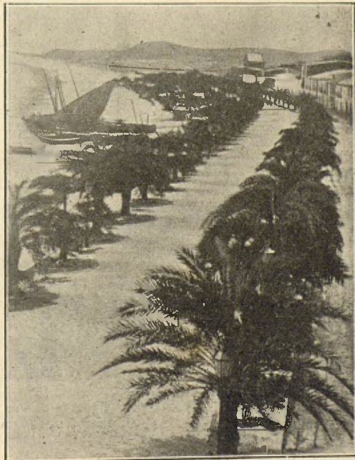
SITGES.—PASSEIG DEL DR. ROBERT.

Tots lo miraren redressarse triomfant, com