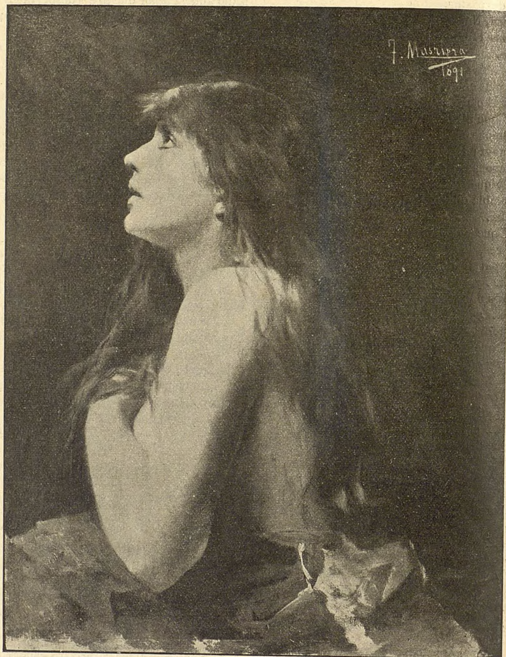
MAGDALENA. — CUADRO D'EN FRANCISCO MASRIERA ( Museu de Barcelona )