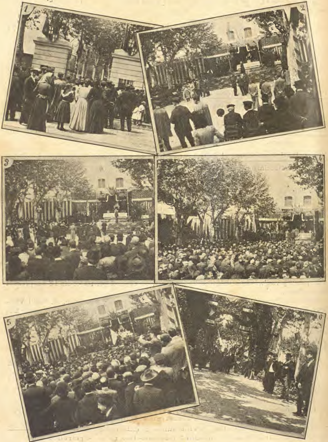
1. Entrada á la fábrika d'en Ricart hont tingué lloch la festa.—2. Preparant l' altar pera la missa de campanya.—3. Las autoritats anant á pendre sitial.—4. El Somatent armat ohint la missa.—5. El Bisbe de Solsona benehint la nova bandera del Somatent.—6. El Somatent preparantse pera la revista.

(Instantaneas de nostre col·laborador artístich en Pere Reig)