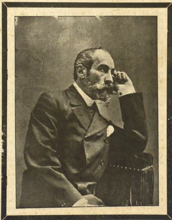
EL PINTOR FRANCISCO MASRIERA