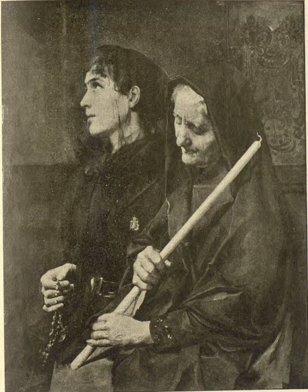
LA PROMETENSA. — CUADRO D'EN FRANCISCO MASRIERA