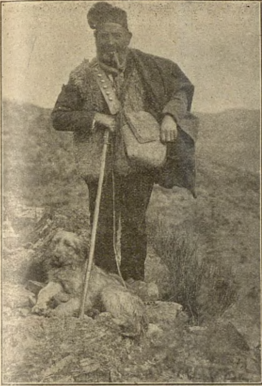
Un pastor de LA ROCA