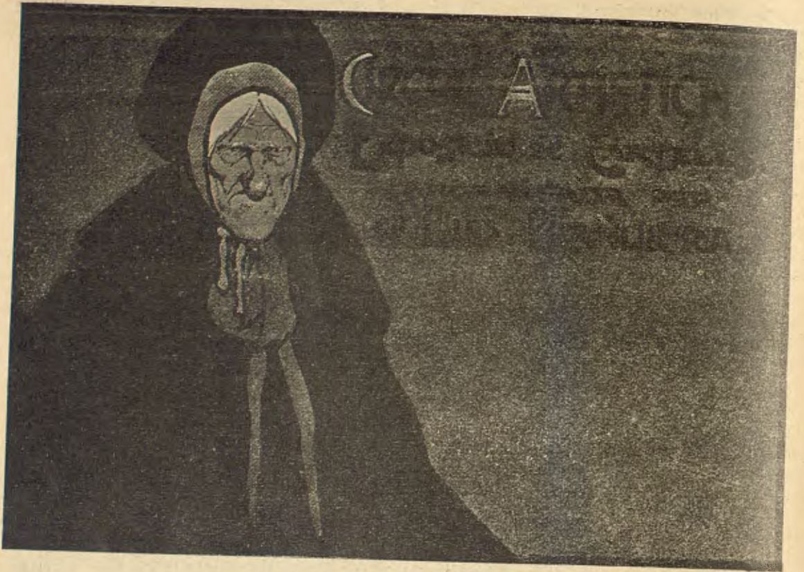
Facsimil de la invitació.