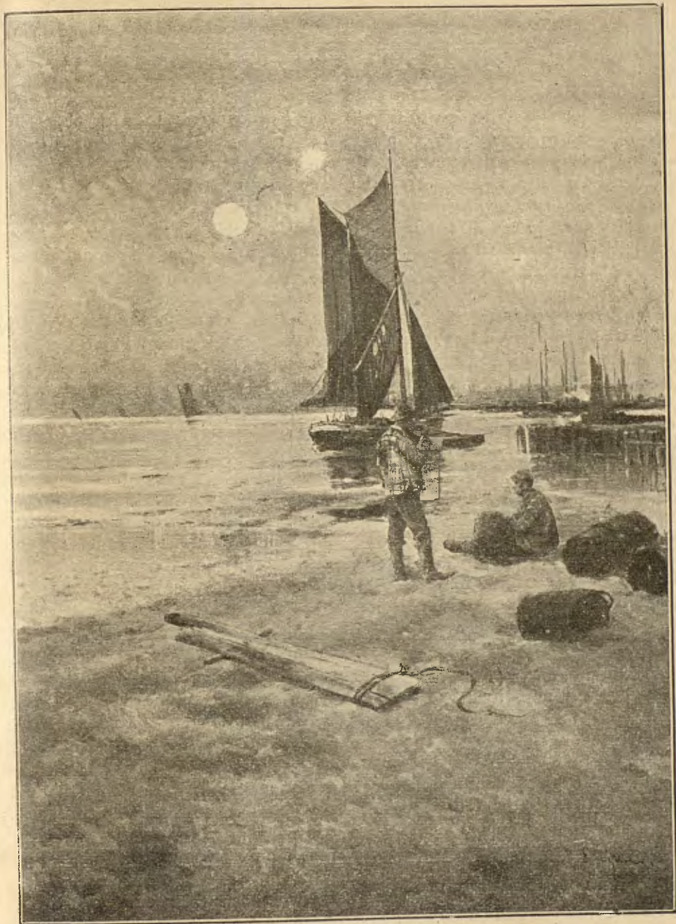
EN LA PLATJA.- Cuadro d' ELISEU MEIFREN