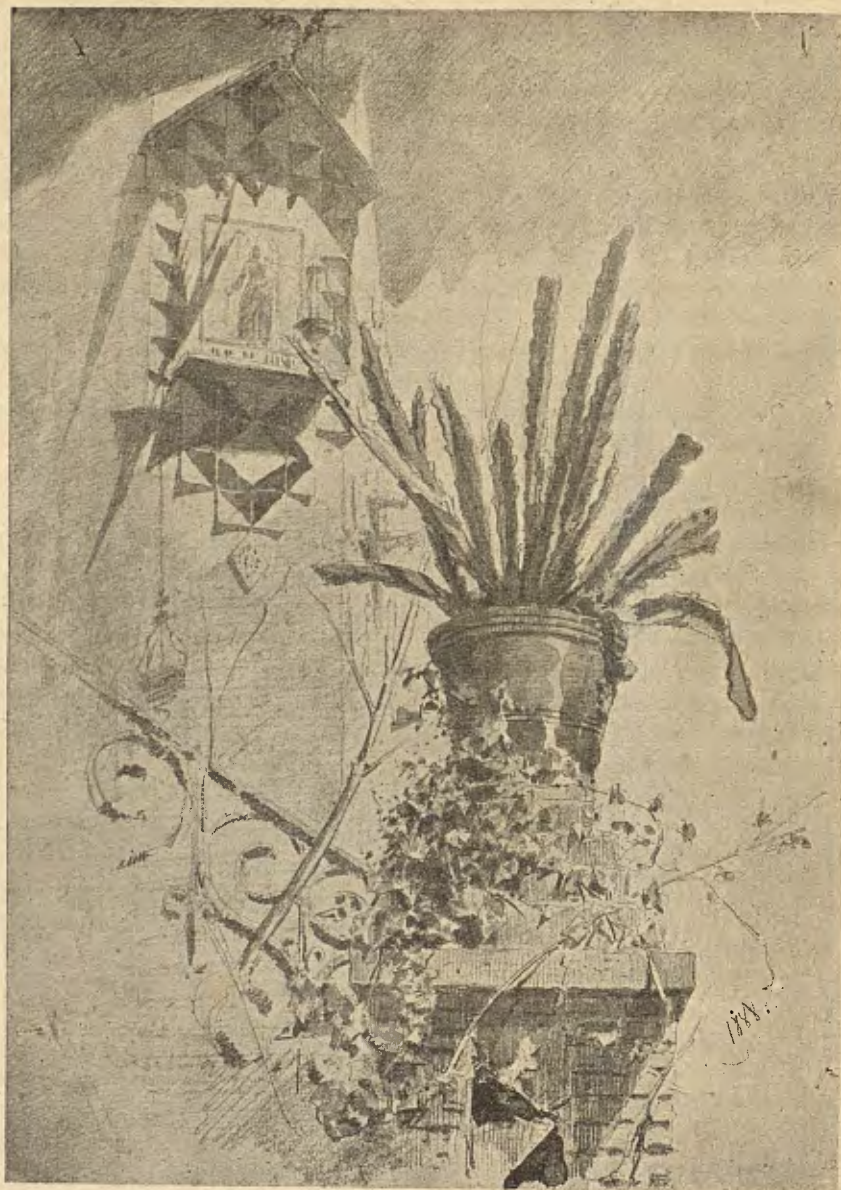
MELANGIA.—Composició de E. Soler de las Casas

en la paret, una gábia ab una cadarnera. Així que entravam, l'aucell feya un xirrich, com saludant á son carceller que li deya: