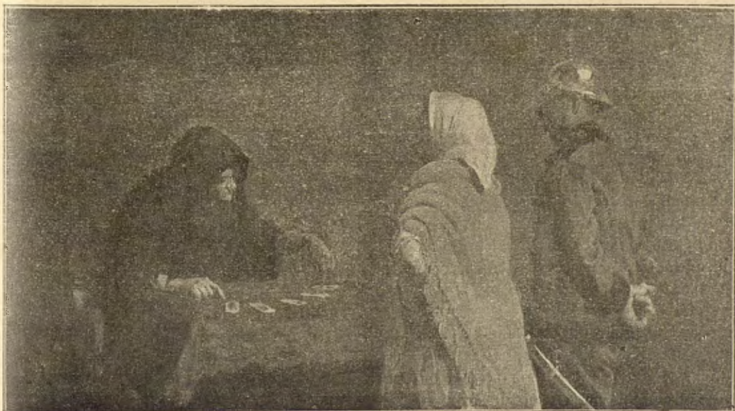
ELS SUPERSTICIOSOS.—Cuadro á en Ricard Urgell

Las dugas amigas se trasladaren altra volta al saló, enrahonant sempre del mateix; y es