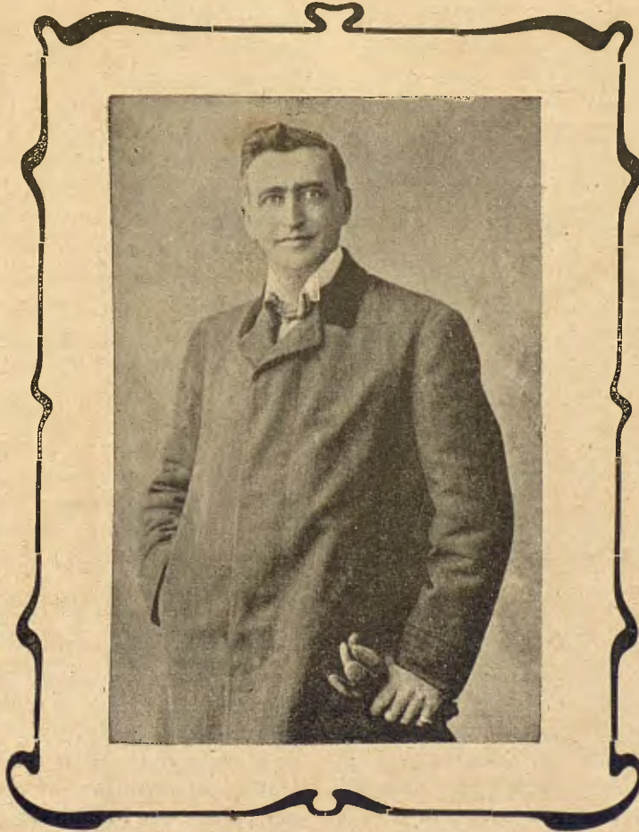
EL BARITON DELFÍ MENOTTI