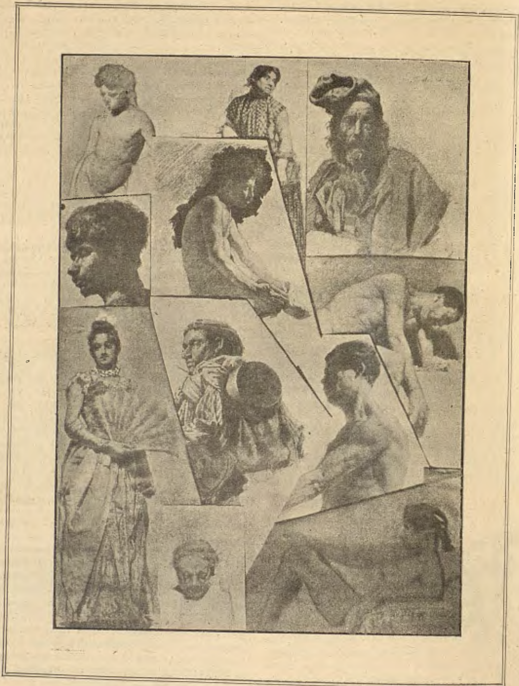
ESTUDIS, per E. Soler de las Casas

com aixís se va dir en la segona representació que sense protesta de ningú va resultar mes arrodonida.