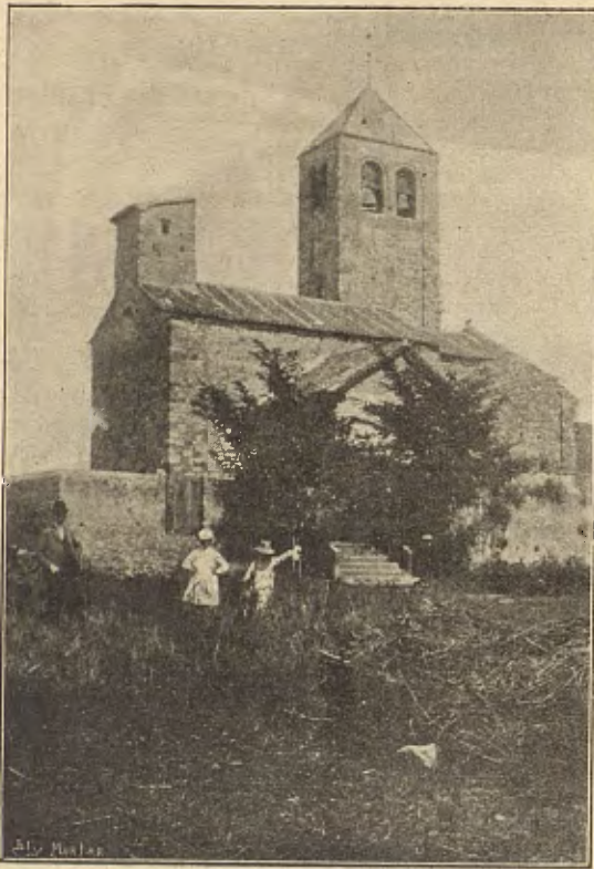
Iglesia de Barbará del Vallés