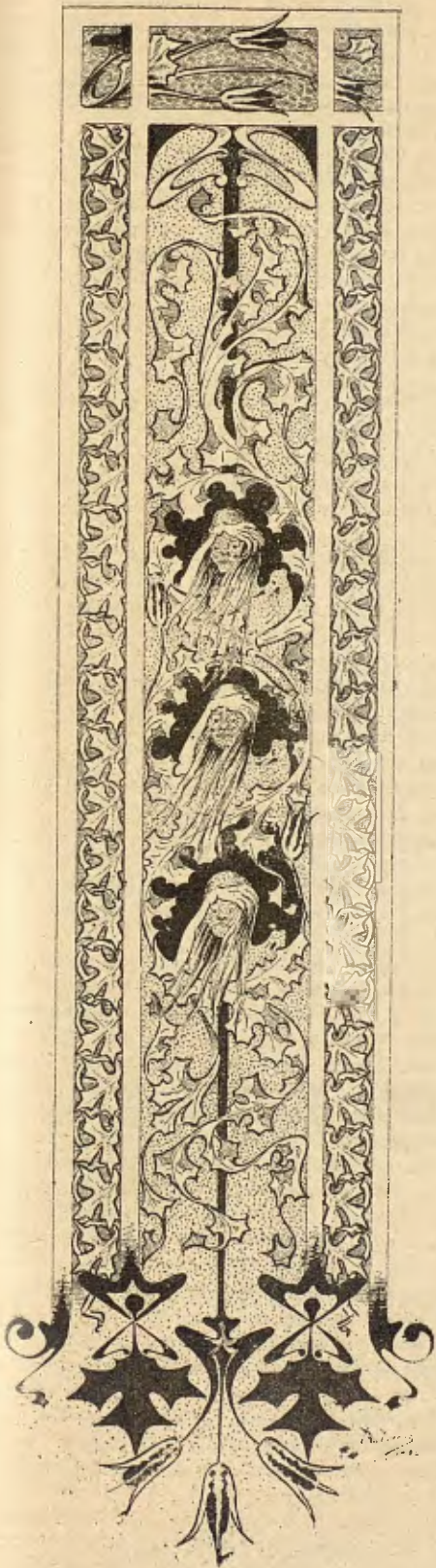
Orla de Yance

El pobre moliner, pensa en sa filla; pensa en sa filla hermosa y complascenta d' abans, que s'esforsava en ajudarlos, pe'l bon reculliment de la familia.