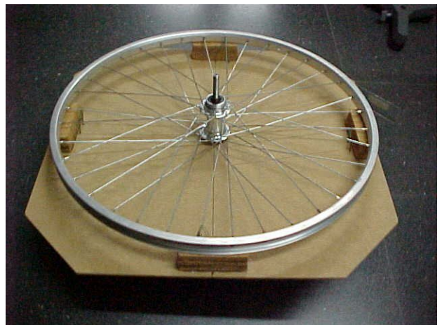
Figura 2. Vista de la part superior.