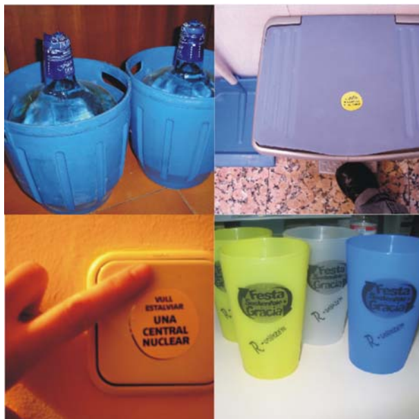
Figura 2. Algunes de les imatges penjades a la web "jo sóc la solució". D'esquerra a dreta i de dalt a baix: a) Envàs reutilitzable. b) Reciclatge. c) Apagar llums. d) Qui vulgui muntar festes sostenibles a Gràcia que demani gots reutilitzables.

Està clar, tanmateix, que hi ha altres comportaments com ara invertir en energies renovables, estalviar aigua, viatjar menys o no sobrepasar els 90 km/h anant en cotxe. Els gestos concrets que es promouen amb aquesta campanya són: