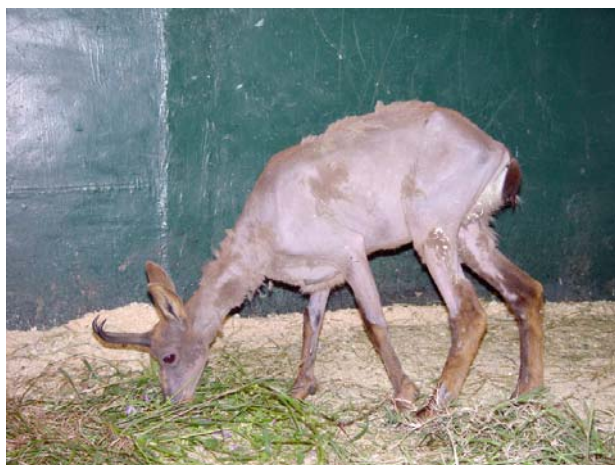
Figura 3. Un isard, capturat amb facilitat, mostrant una extensa alopecìa.

Vistos de prop presentaven desnutrició, paràsits abundants (paparres), debilitat del pèl, amb grans clapes on l'havia perdut (alopècia) (fig. 3) o que es desprenia amb facilitat, i zones de pigmentació cutània alterada (hiperpigmentació) (fig. 4).