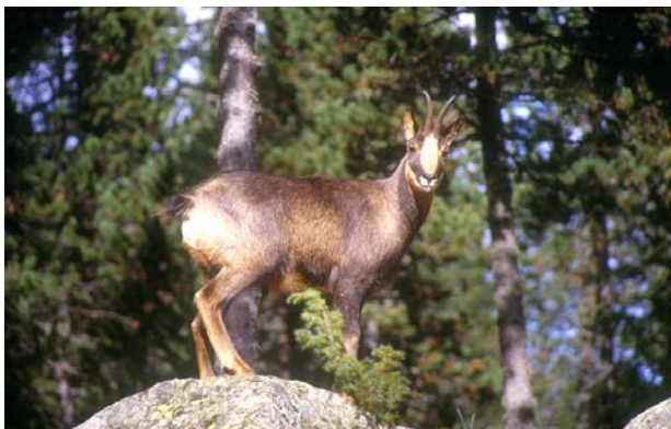
Figura 1. Un isard en el seu medi natural.

A Catalunya es troben isards en estat salvatge (fig. 1) en diverses zones del Pirineu i Pre-Pirineu. L'isard ( Rupicapra pyrenaica ) és un "mamífer artiodàctil remugant de la família dels bòvids, semblant a la cabra, amb banyes primes i corbades de la punta i pelatge fosc amb taques blanquinoses al cap, que habita les zones muntanyoses del sud d'Europa" (IEC, 2007).