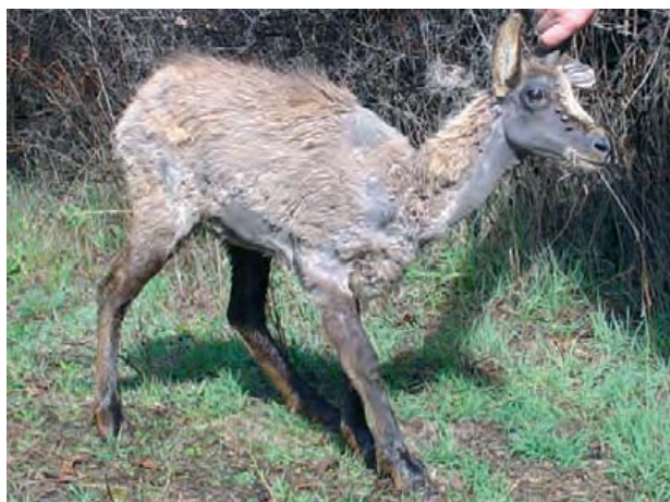
Figura 4. Isard capturat. Presenta aprimament, alopecìa, paparres i hiperpigmentació cutània.

Ara sabem que la malaltia fa que els animals afectats es vagin aprimant, sofreixin una minva en les seves defenses que els fa més vulnerables a infeccions pulmonars, diarrees, etc. També els afecta el cervell.