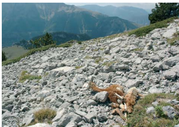
Figura 5. Restes d'un isard mort per la malaltia al Parc Natural del Cadí-Moixeró.

Tractant-se d'una espècie salvatge que viu en un medi tan agrest és impossible saber el nombre exacte d'individus malalts o morts (fig. 5). L'única forma de tenir-ne una estimació és a partir de censos que es fan anualment a tot el Pirineu, sempre amb el mateix mètode.