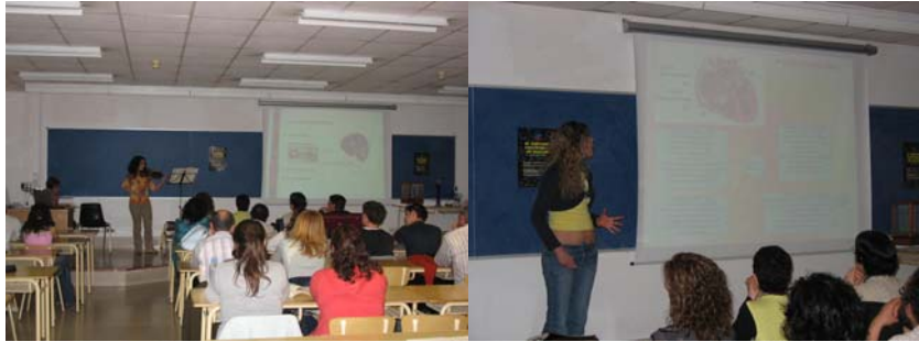
Presentació de treballs