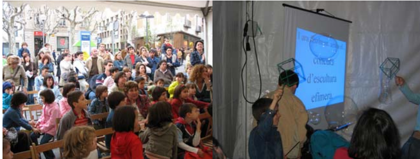
Ciència al carrer

Seria desitjable que més iniciatives d'aquesta mena s'estenguessin pel territori. Si algun dels nostres companys s'hi anima podeu demanar informació a l' Associació .