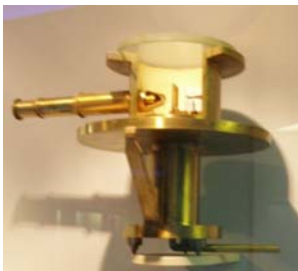
Còpia de l'aparell utilitzat en l'experiència de Mardsen, Geiger i Rutherford

Una bona recomanació a tot el professorat: no us perdeu el Deutches Museum perquè tot i la seva estètica clàssica resulta molt i molt interessant!