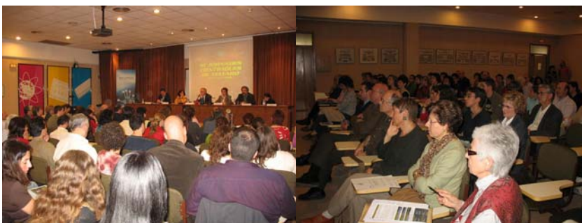
Inauguració de les Jornades